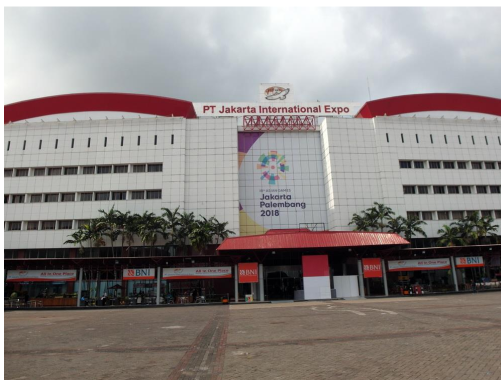
雅加達國際會展中心

2019 年印尼國際汽車零配件展自 3 月 20 日至 3 月 22 日於雅加達國際會展中心圓滿結束，本展是由印尼工業部、印尼外貿部、印尼駐法工商總會、印尼汽車中心、印尼展覽貿易公會、印尼汽車零部件工業公會等相關單位所共同贊助，包含印尼當地廠商，共有來自澳大利亞、比利時、保加利亞、德國、香港、印度、日本、沙烏地阿拉伯、韓國、立陶宛、馬來西亞、中國大陸、台灣等 34 個國家地區超過 1,048 家廠商參展，使用 25,132 平方公尺，三天的展期，共吸引了 20,502 個買主參觀。