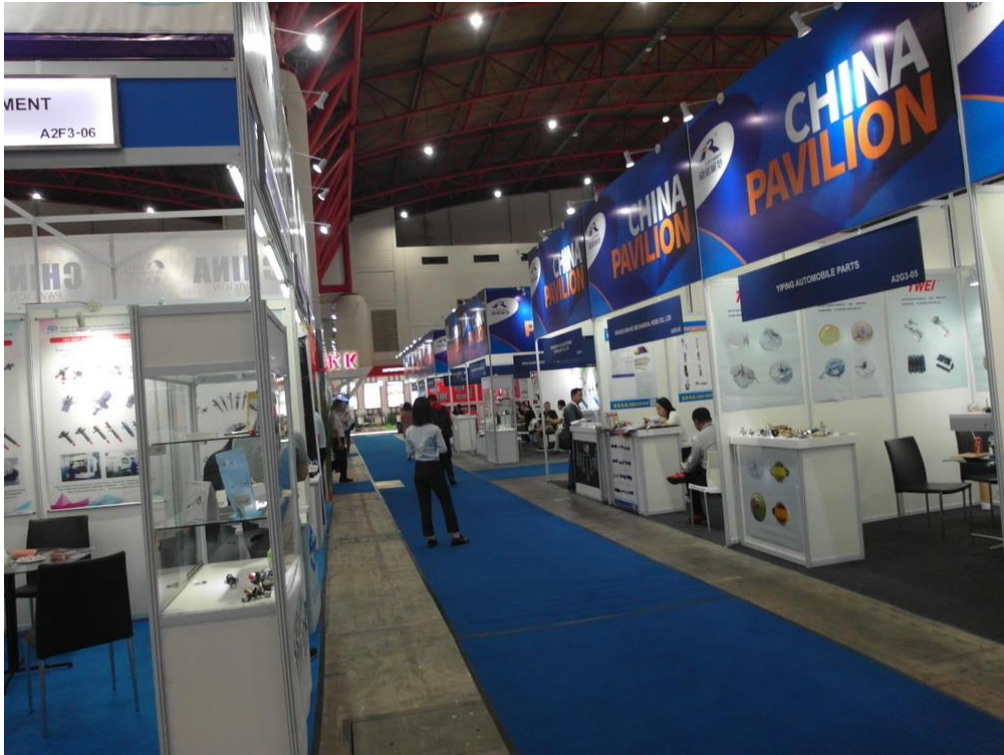
中國大陸參展廠商最多