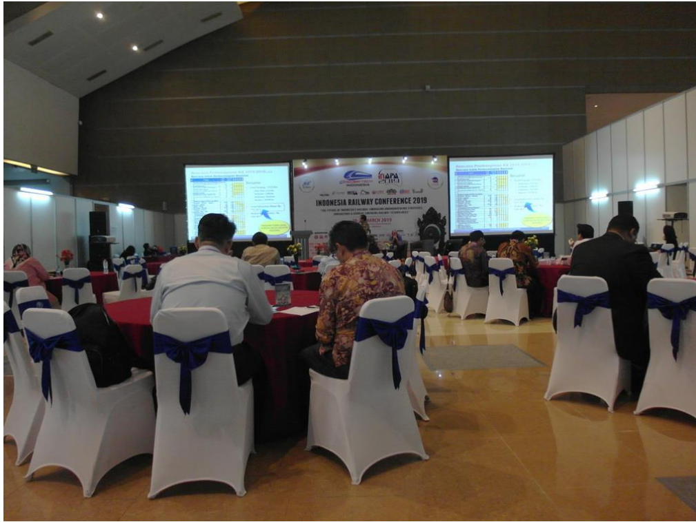
展覽期間舉辦多場研討會