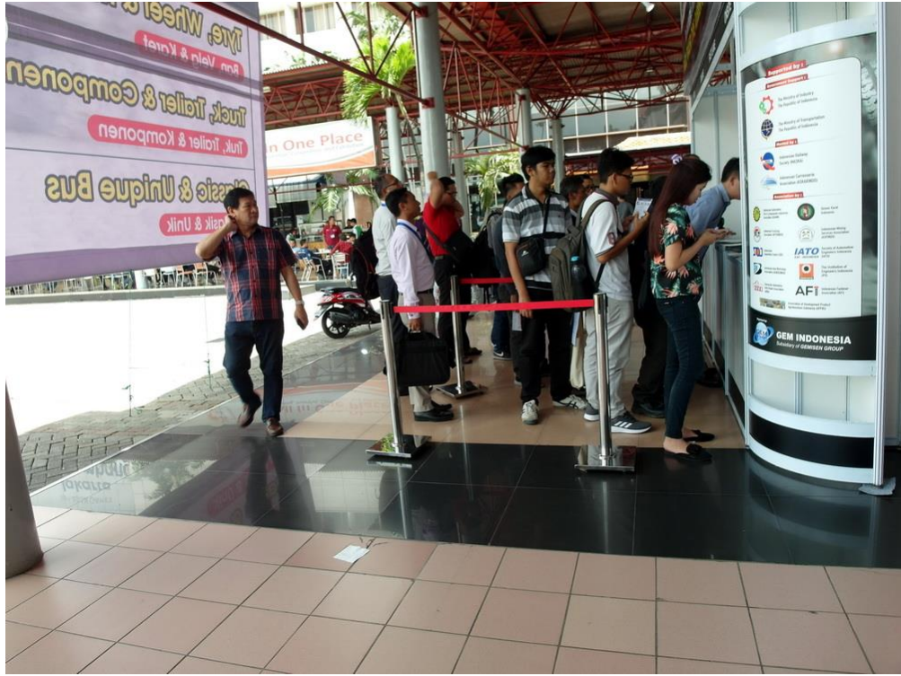
登記處排隊等待換證入場的人潮