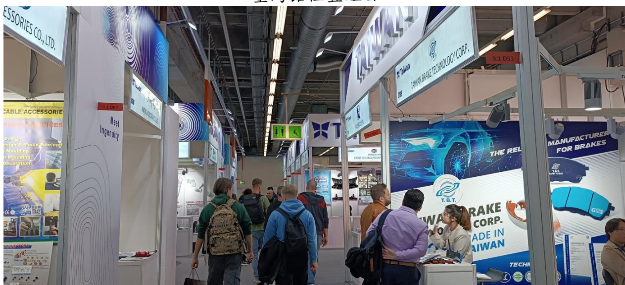
9.1 館全是臺灣參展廠商