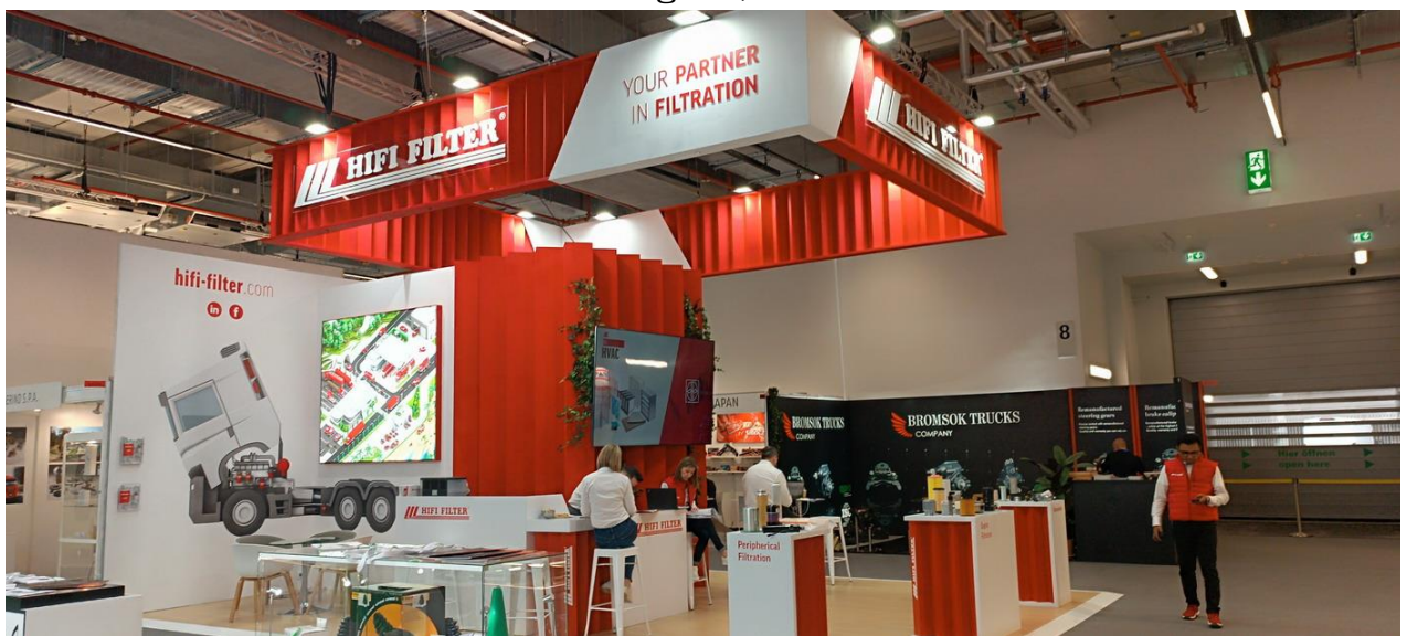
HIFI FILTER 展位