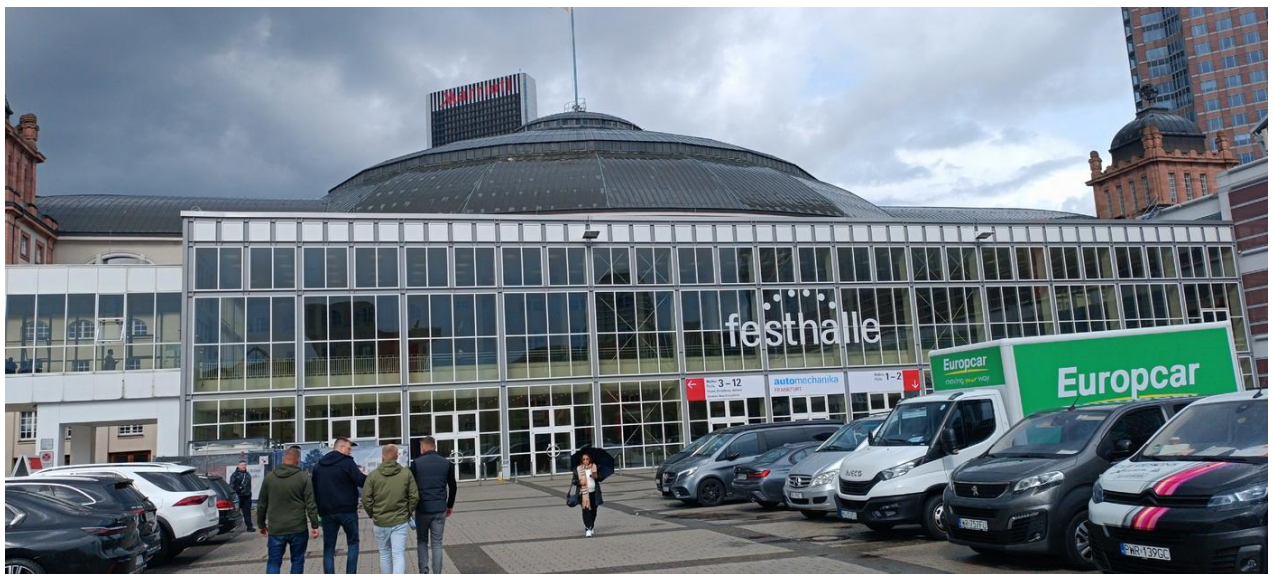
德國法蘭克福展覽會場