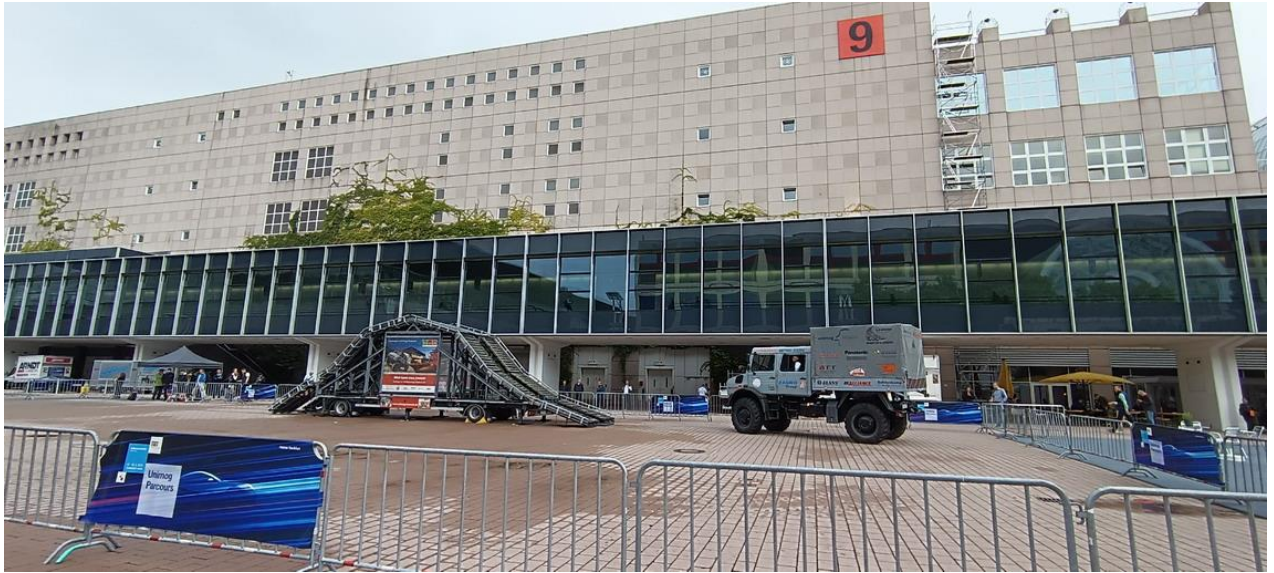
臺灣展商大多位於 9.1 館