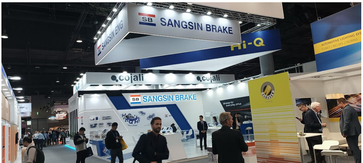
SANGSIN BRAKE 展位