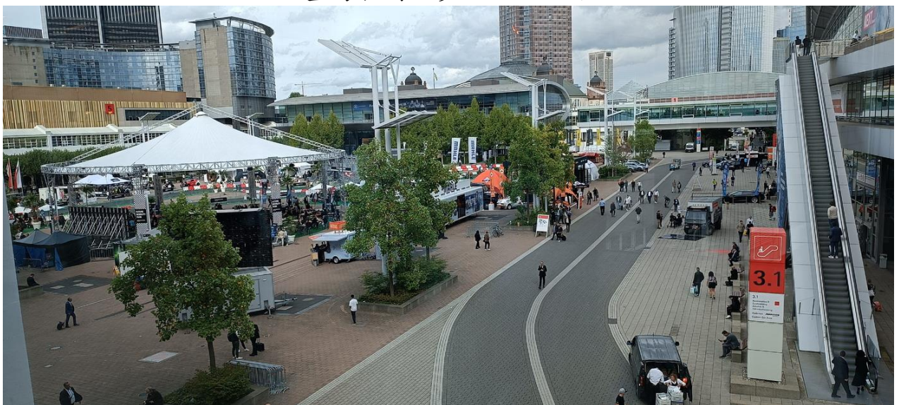
法蘭克福展覽會場外圍一景