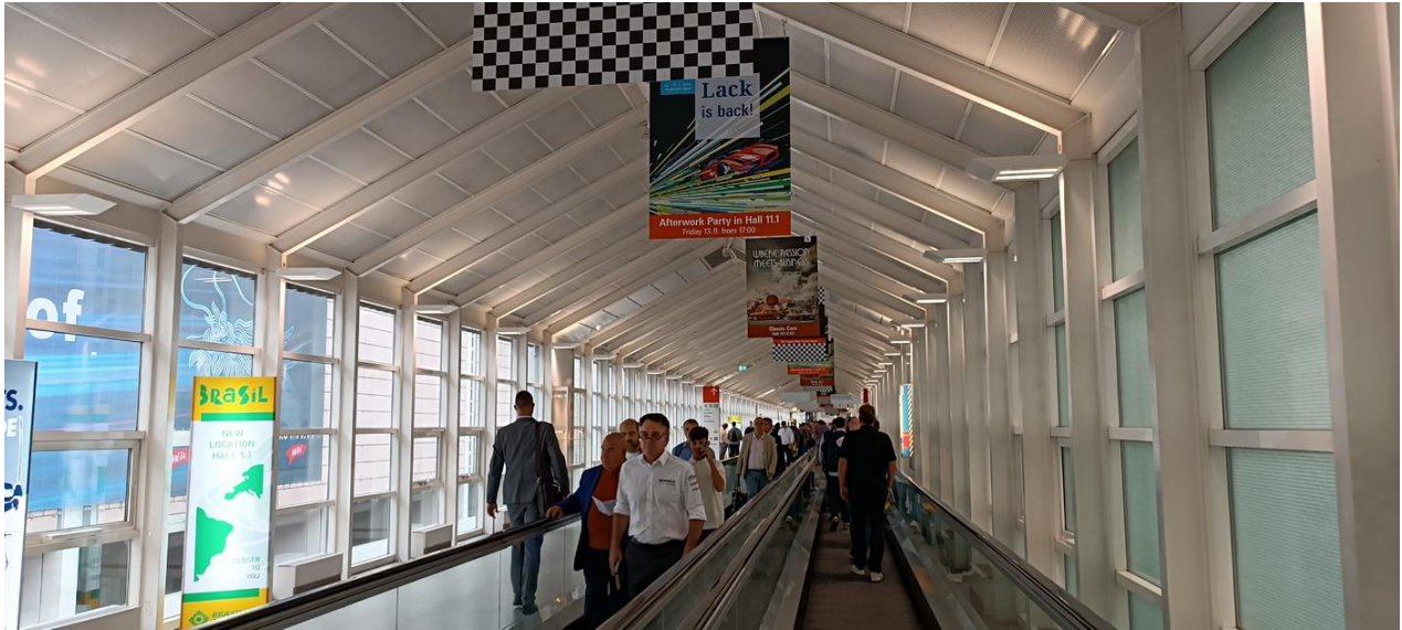
買主來往於各展館間的電動步道