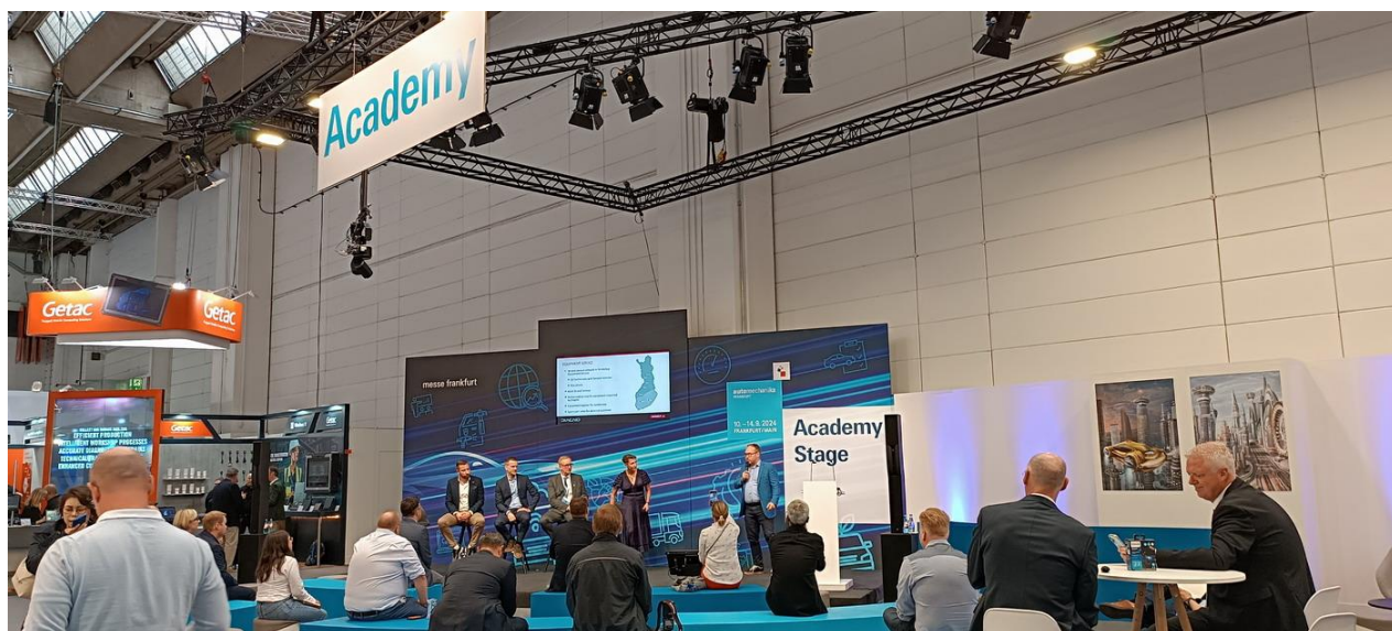
展覽期間多展館舉辦各項研討會

Automechanika Frankfurt 為全球汽車專業人士的首選展覽會。今年的主題圍繞著汽車產業的轉型，包括可持續性、人工智慧、自動化以及新一代人才的招聘。這些關鍵議題貫穿整個活動日程，為參觀者提供豐富的學習和交流機會。