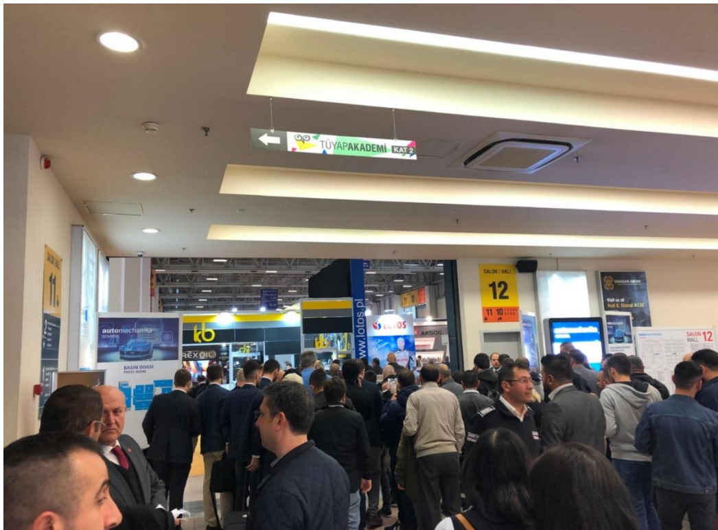
排隊等待換證入場的人潮