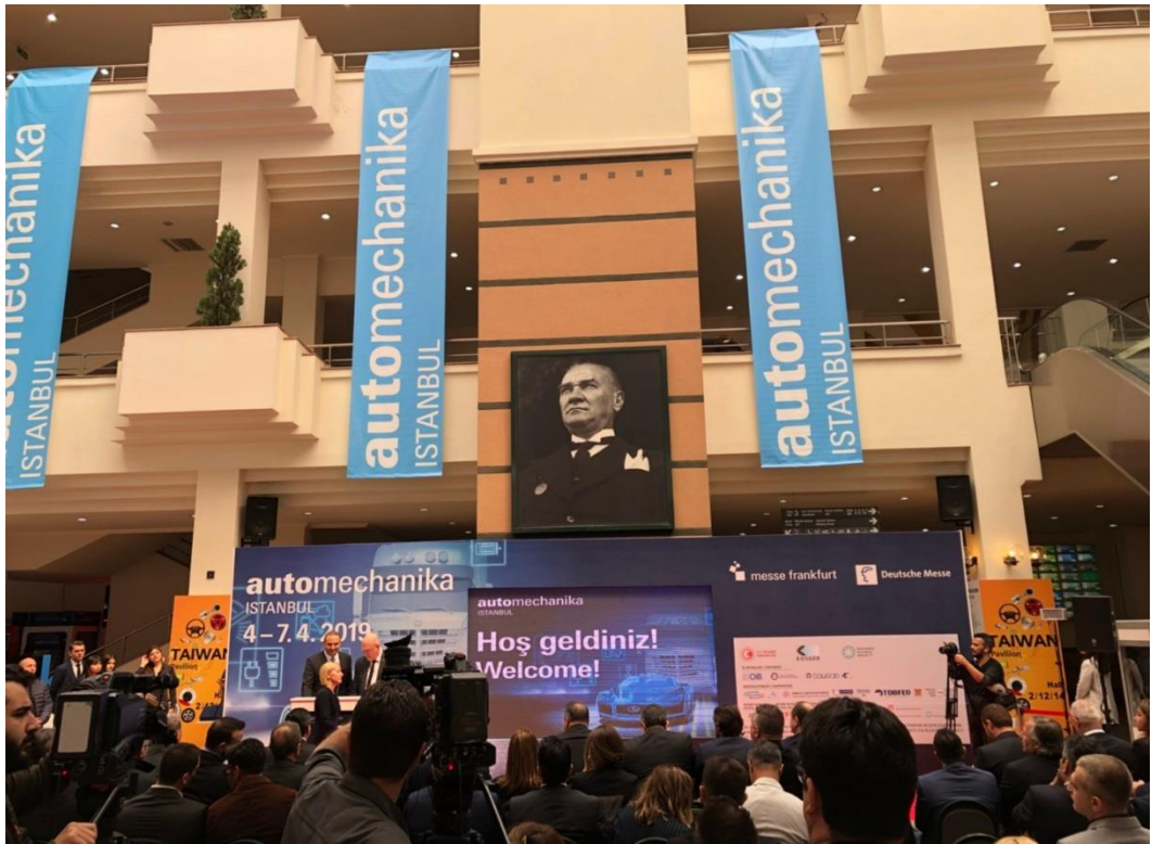
第一天開幕典禮隆重登場