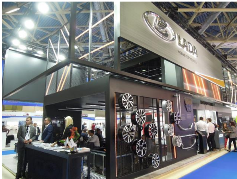
俄羅斯 Lada 公司攤位