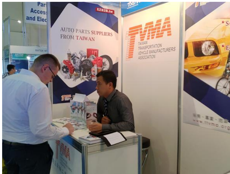
買主參觀本會服務攤位