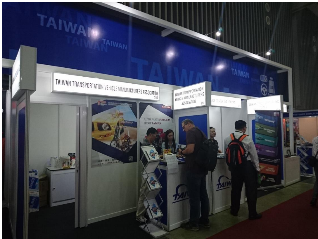
本會服務攤位提供買主相關資訊