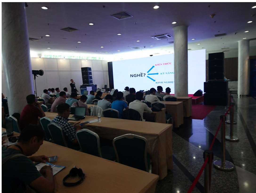
汽車保養維修論壇