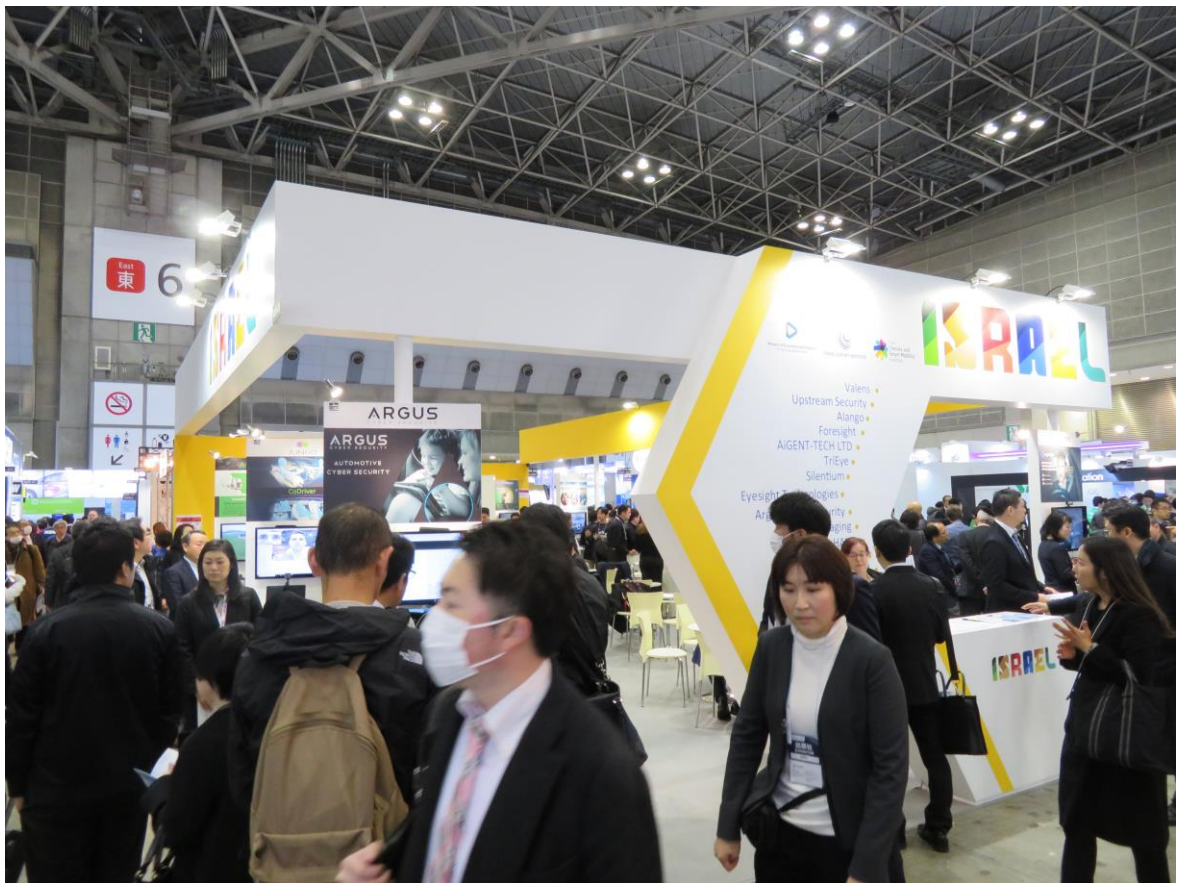
以色列國家館展出新創技術如駕駛人監控系統(Driver Monitoring System)等