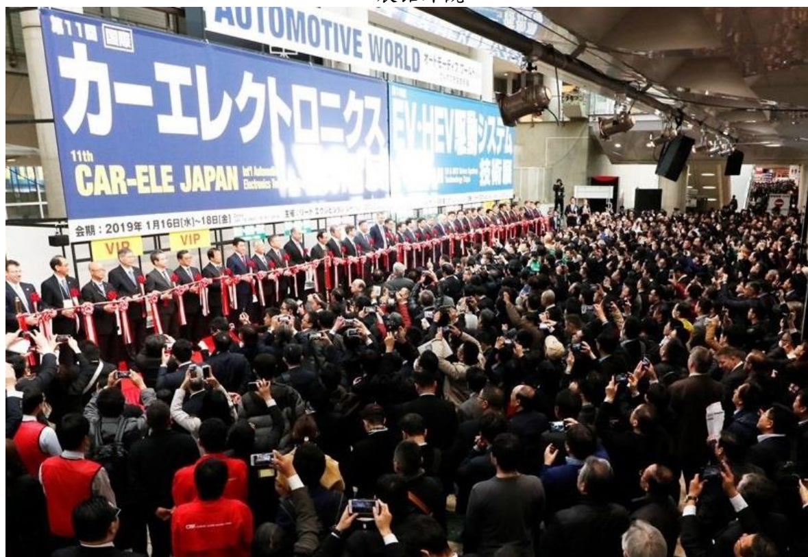
本展會於開幕當天在東館大廳中央盛大剪彩開展