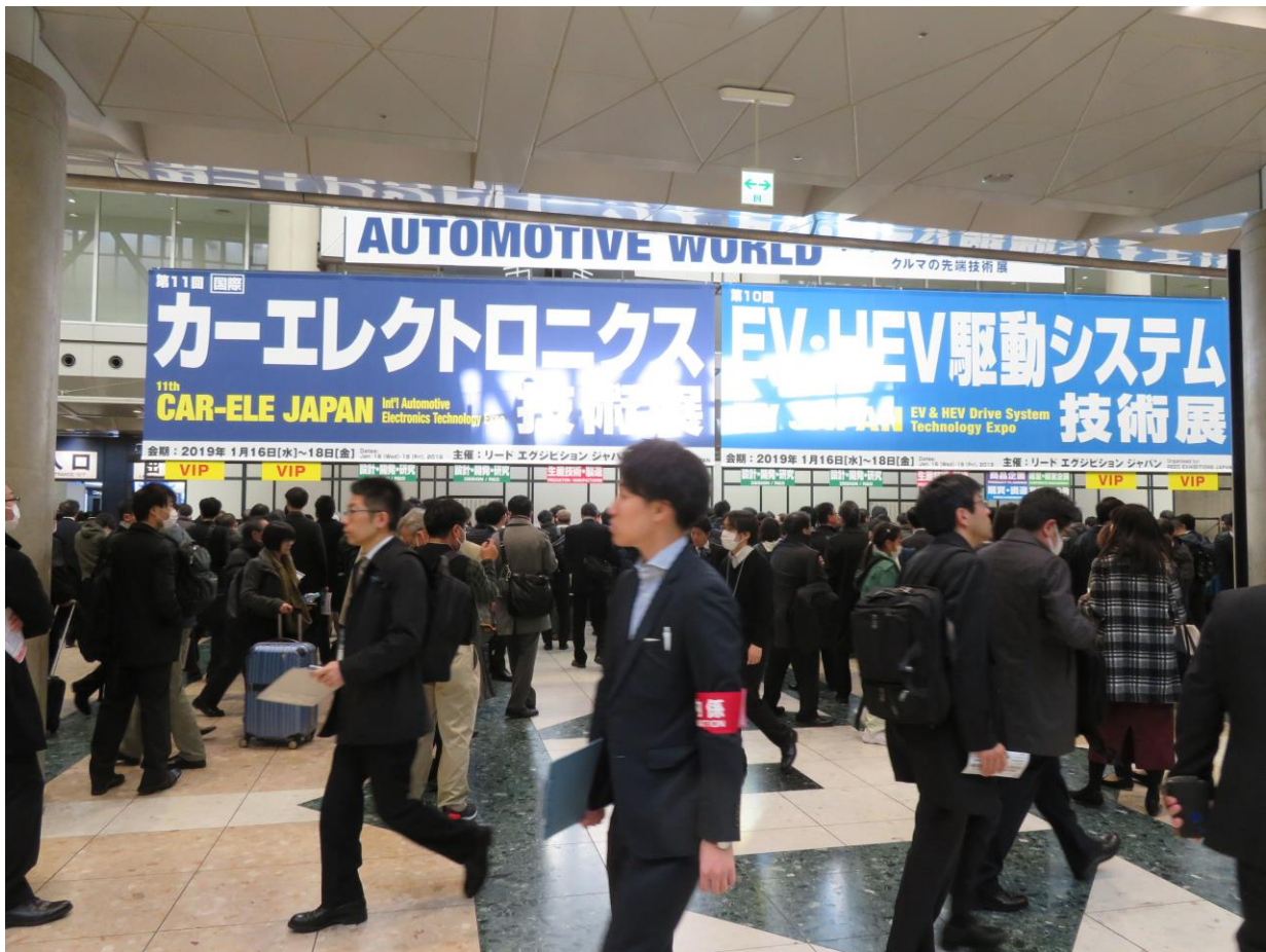
東館展場入口處換發入場參觀證服務，參觀人潮不斷。