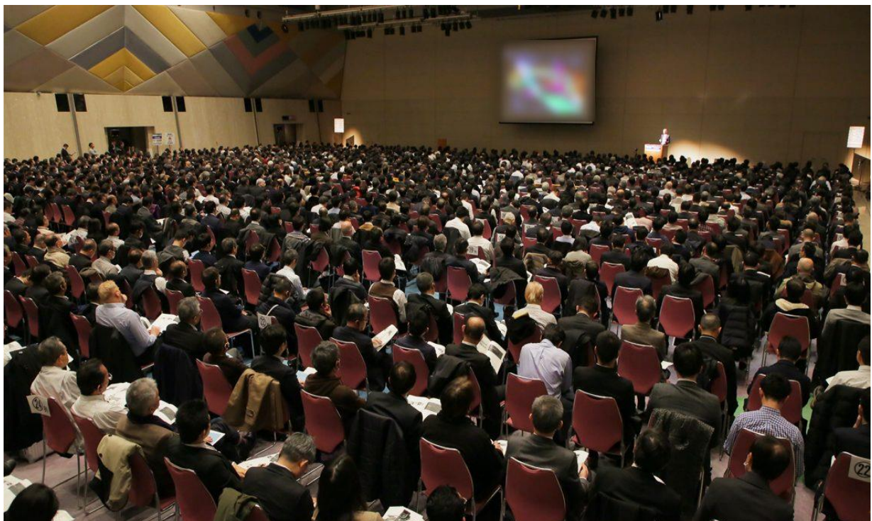
展會中舉辦相關技術高峰論壇