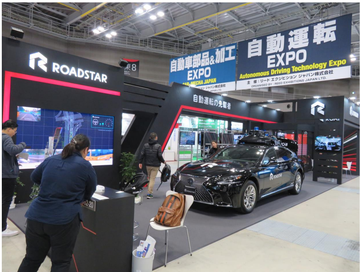
熱門的自駕展區參展商較去年有近兩倍成長