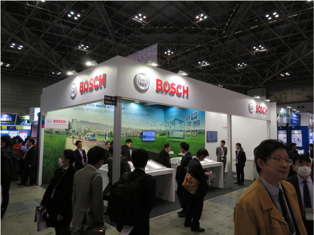
BOSCH 公司展示汽車售後服務的資訊軟體能提升汽車售後流程的速度和效率