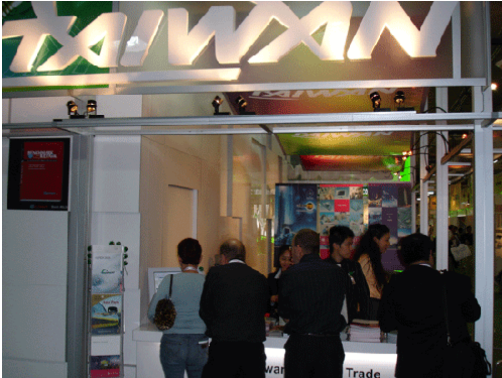
買主至本會和外貿協會共同投置之服位上洽詢國內廠商