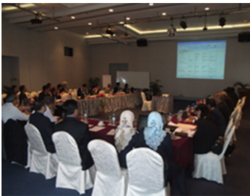
專案小組開會情形(一)

馬來西亞：舉行「全球道路安全」週；宣傳免費附贈安全帽、免費機車檢查及贈送反光貼紙等，另有道路安全和騎乘安全之宣導活動等。海報宣傳強調扣緊安全帽下額繫帶之重要性。 印尼：海報宣傳一樣強調扣緊安全帽下額繫帶之重要性。道路安全宣導活動包括使用道路左側之機車專用道、日間亮頭燈等。另會員廠亦舉辦安全騎乘之訓練等。 泰國：進行安全騎乘、考照訓練及安全常識宣導等；自動亮頭燈宣導活動；FAMI道路安全宣傳海報發行；推廣兒童安全帽及「喝酒不開車、開車不喝酒」之宣導活動。 新加坡：與警察等政府機關和機車騎士俱樂部等推廣道路安全活動；交通局舉辦道路安全研討會；道發行路安全宣傳海報。 菲律賓：與政府機關合作發行道路安全宣傳海報、鼓勵戴安全帽之貼紙廣告宣傳、發行安全騎乘之技術指導手冊。 台灣：配合政府推廣道路安全計畫-兩段式左轉、尊重路權等。舉行道路安全之海報競賽及角色扮演等。