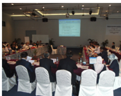
管理委員會開會情形