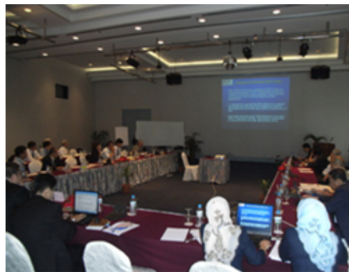
專案小組開會情形(二)