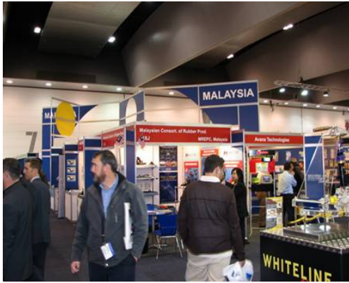
馬來西亞攤位一隅

根據澳洲汽車售後市場協會(AAAA)統計指出，至 2006 年底，澳洲全國登記之汽車數量已達 1 千 4 百多萬輛，其中轎客車佔登記車輛之 78%(約 1120 萬輛)，較 2005 年成長 3.4%，且私人汽車普及率為每千人 699 輛，也讓澳洲成為全球汽車普及率第三高的國家，可見汽車對澳洲人的重要性。另據 AAAA 統計，年度新車零配件及售後零件市場估計約達 81 億澳元，且每年進口之各類汽車零組件約為 21 億澳元左右(相當 580 億台幣)，近年來年成長率約 3%，可見澳洲汽車零件市場具有相當成長潛力，亦值得我國廠商前來開拓市場。