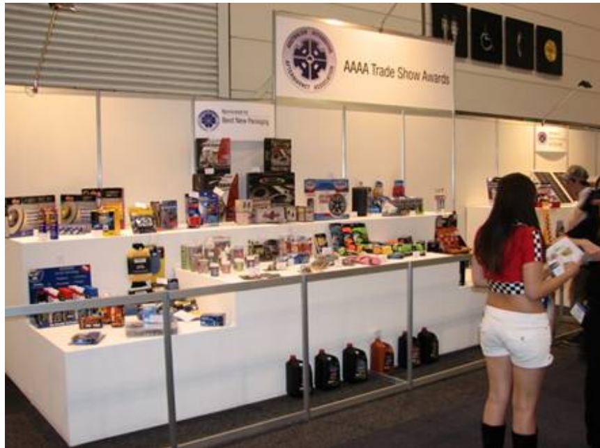
創新產品得獎陳列

國（含香港）、泰國、馬來西亞、美國等數十個國家近 350 家廠商參展，展出面積達 2 萬平方公尺，整個展場只有台灣、泰國、馬來西亞設有主題館，台灣館整體主題館設計醒目新穎是最突出的展館，雖然，除了澳洲本地的廠商，中國大陸是最多參展廠商的國家，可惜資源沒有整合，廠商分布零散，參觀人潮不多。