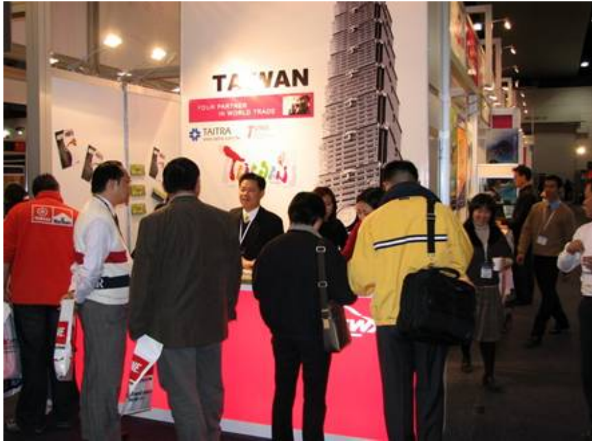
本會與外貿協會聯合攤位前人潮絡繹不絕

2006年1至12月台灣汽車零組件出口值達新台幣近1,329億元，較去年同期增加3.83%，前五大出口國依序為美國(37.53%)、中國大陸(8.04%)、日本(5.25%)、澳洲(3.06%)及德國(3.06%)，顯示澳洲是有潛力可以經營的市場。台灣汽車零件業早已具備國際競爭能力，品質已達國際水準，中衛體系配合完整，可快速互相支援，模具工業極具競爭力。且台灣車廠相繼興建技術研發中心，漸成為亞洲地區設計中心，可望帶動汽車上、下游相關產業發展。目前計有600餘家廠商取得ISO9000認證，並有160餘家取得美國三大車廠之QS9000認證，每年外銷金額均持續擴大，並積極赴中國大陸及東南亞投資設廠，已成為國際分工體系之一環，且熟悉中國大陸市場，是外商理想的合作夥伴。