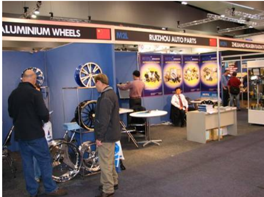
中國大陸攤位一隅

零售連鎖店 Repco、Autobarn、KOZMA、ET Performance 及 Delphi 等十數家大型企業採購部門前來參觀台灣館展區，並且 Holden Special Vehicle 在第一天就與大龍企業談妥進行初步合作，未來將於新車型上試行採用大龍企業所開發之模具鈹件，並且除了大龍外，該採購經理並也到相關產品攤位進行洽詢，對台灣產品感到相當興趣，並表示未來向台灣採購的機會相當大，顯示台灣產品在澳洲市場亦具有相當競爭力。