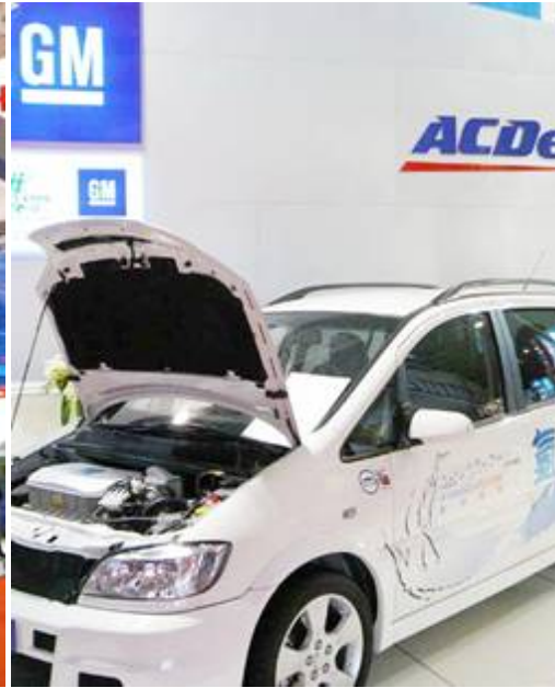
通用汽車(GM)展出氫汽車