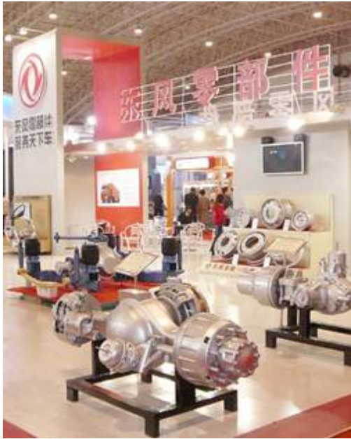
東風汽車零部件展位