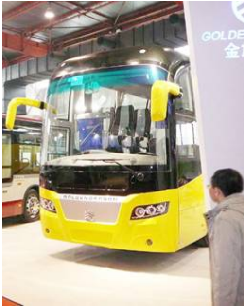
廈門金龍(廈門金旅)展位