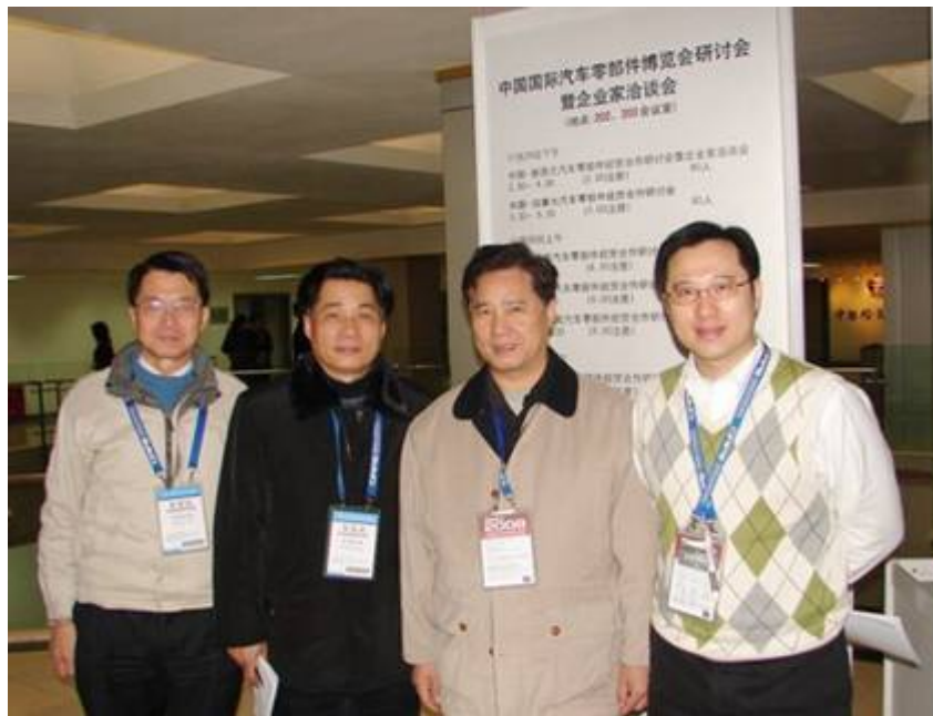
TCPO 協助參展廠商參加「中國國際汽車零部件博覽會研討會暨企業家洽談會」