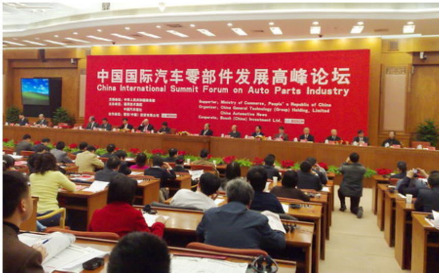
「中國國際汽車零部件發展高峰論壇」於人民大會堂開講