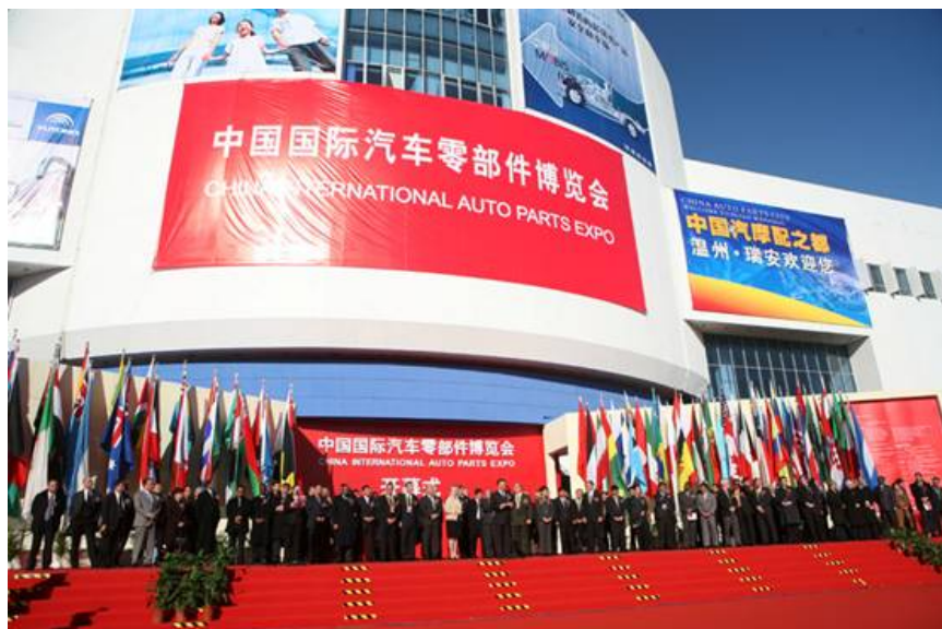
「中國國際汽車零部件博覽會」於北京中國國際展覽中心全場展出

為協助台灣汽車產業廠商搶攻 2007 年新車產銷達 888 萬輛、2010 年保有量可望突破 7,000 萬輛的中國汽車市場,台北車用電子商機推動辦公室(Taipei CarTronics Promotion Office, TCPO),帶領 21 家台灣車用科技設備供應廠,使用 32 個攤位,於重點一號館當中以「台灣車用科技館」的專區方式進行展出,為海內外汽車行業買主,提供在最短的時間內找到優質汽車零部件供應商的最佳服務。