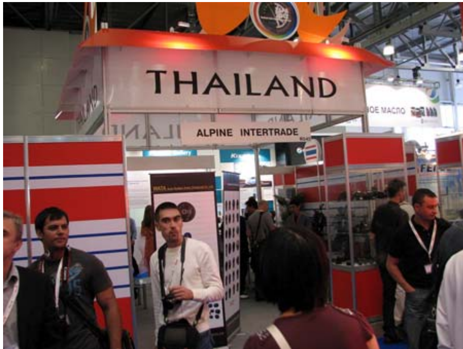
泰國主題館攤位一隅