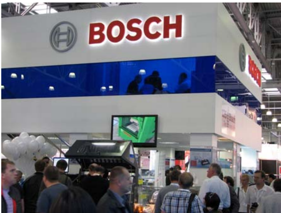
國際知名大廠 BOSCH 展示攤位一隅

由於，俄羅斯每年 5、6 月雪才完全融化，11、12 月就已經是大雪紛飛，雪水融化後流進下水道經過處理就成了重要的飲用水來源，因此，俄羅斯政府為了確保水源的潔淨，禁止私人自行洗車，合法的洗車中心又要價不菲，用噴霧或是塗抹的方式清潔汽車的外表，就成了俄羅斯另類的商機。