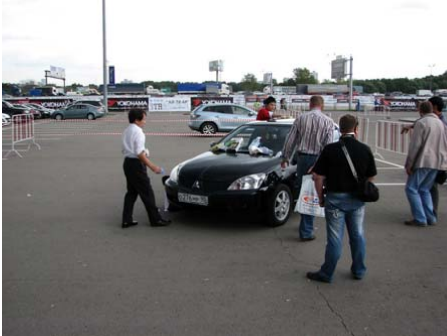
戶外展覽場地正在示範乾式清潔汽車

由於，俄羅斯每年 5、6 月雪才完全融化，11、12 月就已經是大雪紛飛，雪水融化後流進下水道經過處理就成了重要的飲用水來源，因此，俄羅斯政府為了確保水源的潔淨，禁止私人自行洗車，合法的洗車中心又要價不菲，用噴霧或是塗抹的方式清潔汽車的外表，就成了俄羅斯另類的商機。