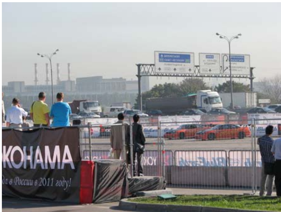
戶外展覽場地有賽車競速表演