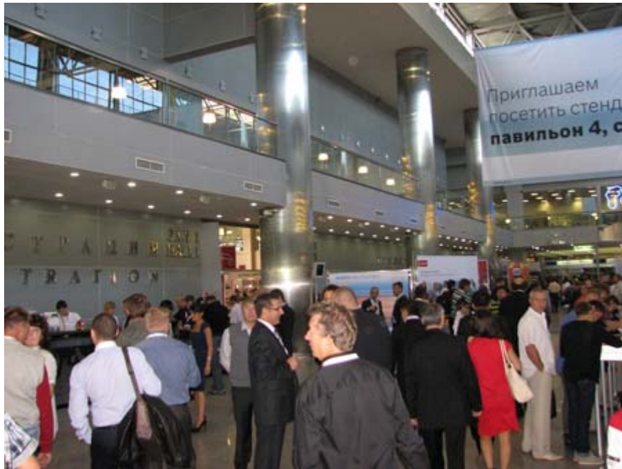
PAVILION 1 展館大廳，入口處設有看板介紹本次展出內容及相關參觀資訊