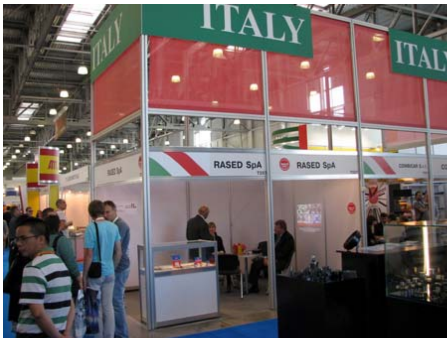
義大利主題館攤位一隅