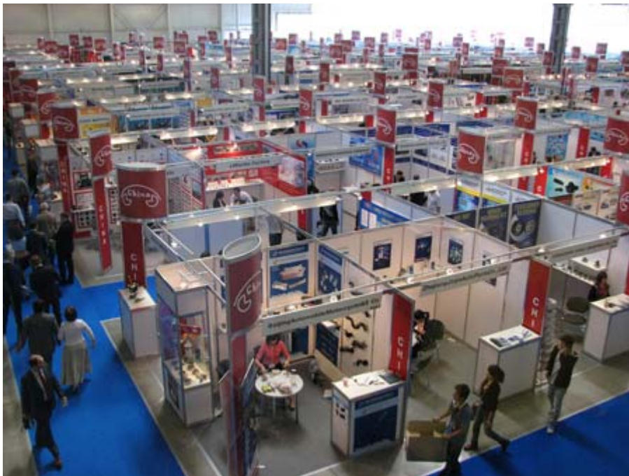
中國大陸主題館規模龐大

中國大陸的國家主題館在 MIMS 展以及 INTERAUTO 展皆有陳列，攤位總面積遠遠超過台灣主題館，尤其是在 MIMS 展，HALL 1 全是中國大陸的參展商，台灣館所在的 HALL 3 也有許多是中國大陸的廠商，世界各地汽配展覽的大會皆喜歡將亞洲國家的展館放在同處展出，近年來中國大陸更是以螞蟻雄兵方式攻佔各式國際大型展覽，可以看出他們的企圖心旺盛，台灣館的廠商以積極的態度以及更為優質的產品品質去說服買家，許多國外的買主，寧願選擇台灣較為優異的產品，而不再是單純的價格考量。