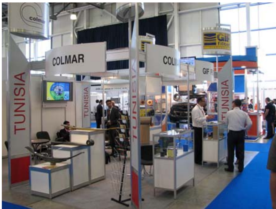
突尼西亞主題館攤位一隅