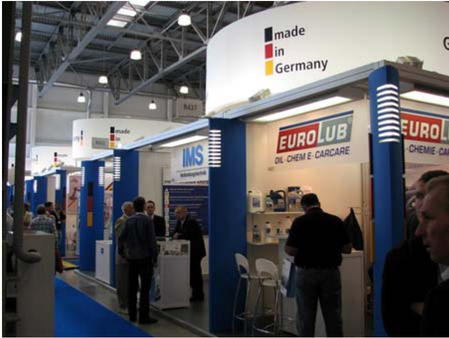
德國主題館攤位一隅