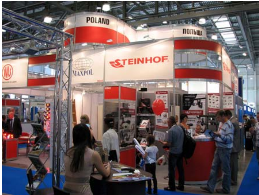
波蘭主題館攤位一隅