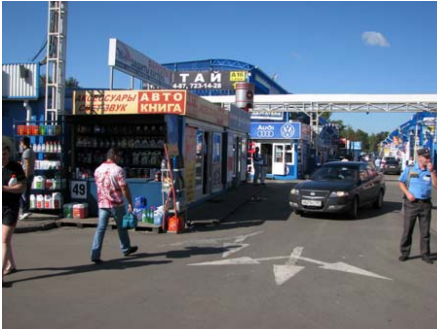
莫斯科內寸土寸金的露天市集，走的卻是平價路線