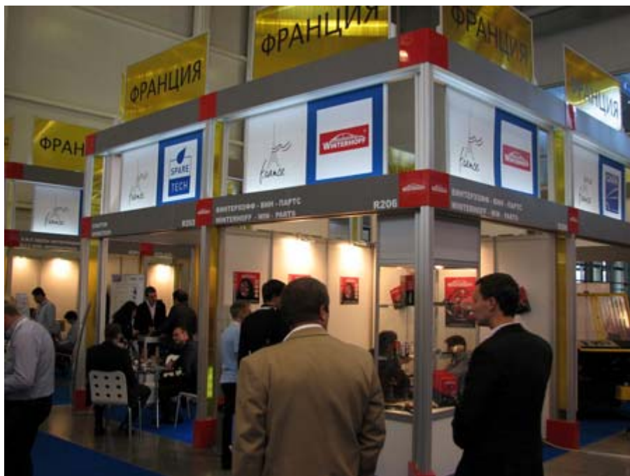
法國主題館攤位一隅