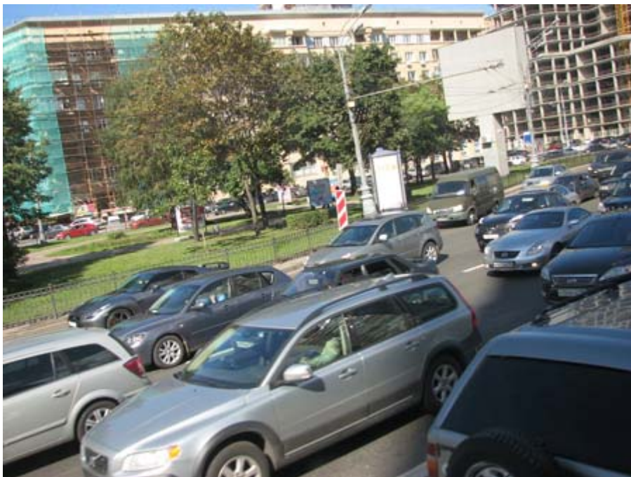
莫斯科街道一整天都常塞車