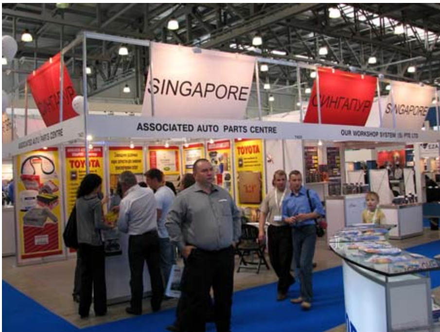
新加坡主題館攤位一隅