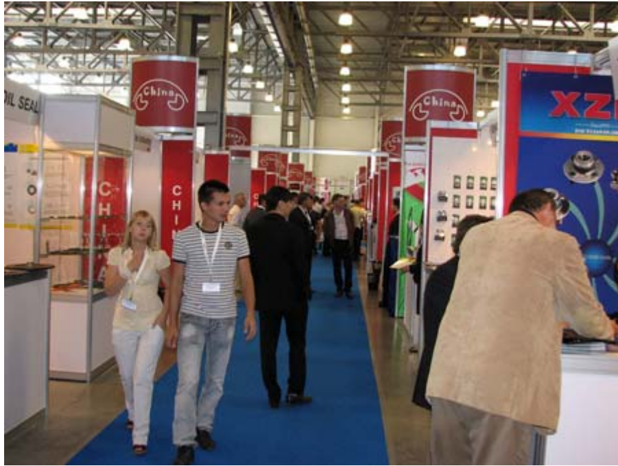
中國大陸主題館攤位一隅