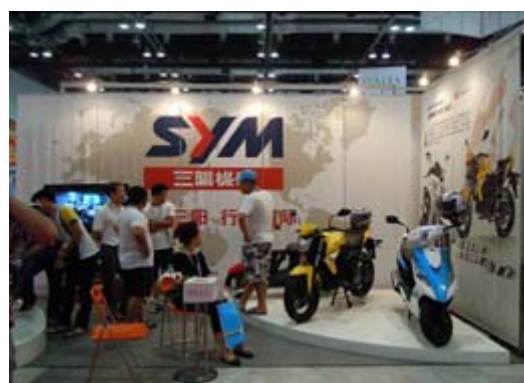
三陽工業攤位展示