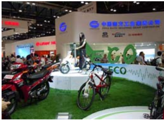
中國南方工業集團展示攤位