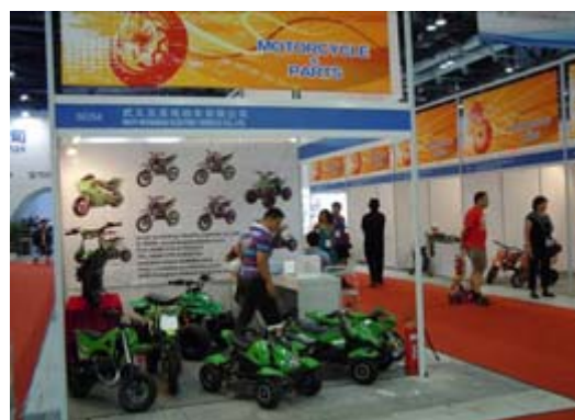
中國摩托車整車及零組件廠商攤位展示 (一)