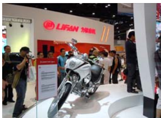
力帆集團展示攤位