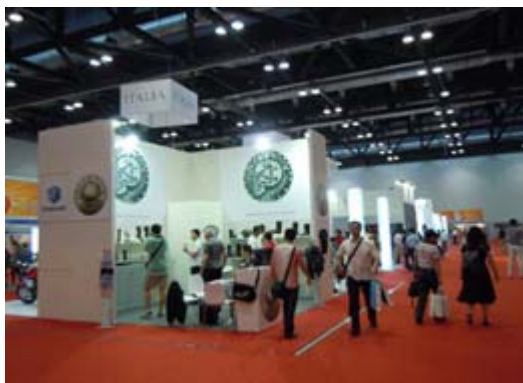
義大利廠商展示攤位