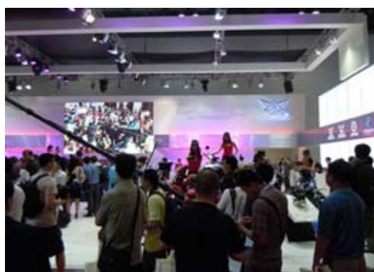
宗申集團展示攤位