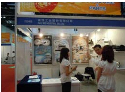
本會會員廠富惟工業攤位展