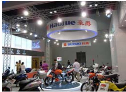
與 ZUZUKI 合作之豪爵摩托車展示攤位