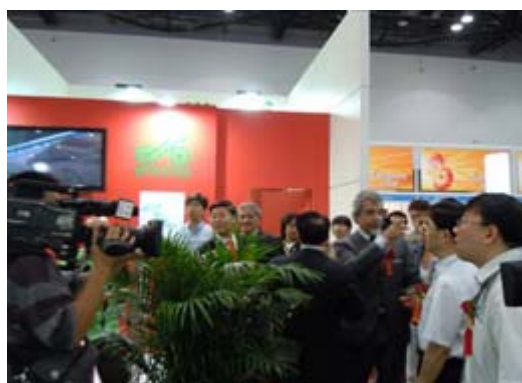
中國商務部部長助理李榮燦出席及義大利使節等到會場參觀