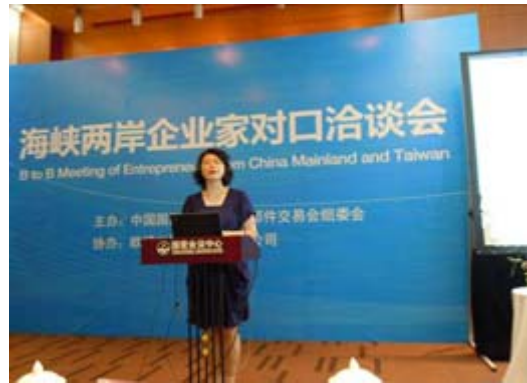
海峽兩岸廠商洽談會