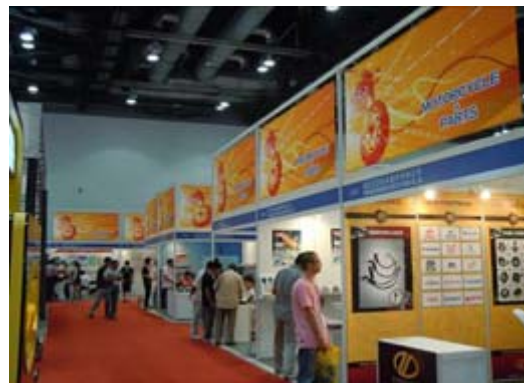
中國零件廠商展示攤位