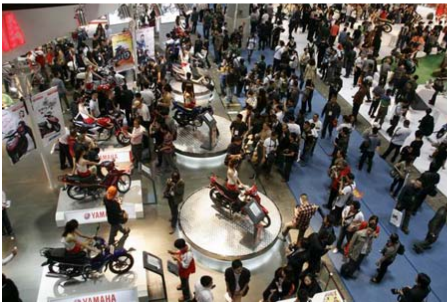
參觀人潮洶湧(展場一隅)