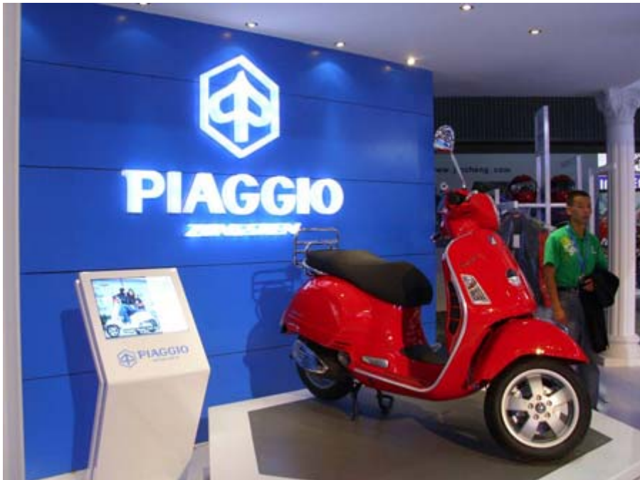
義大利 PIAGGIO 比雅喬展位