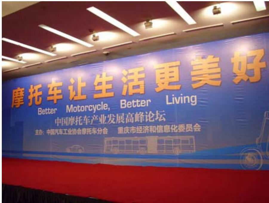
2011 中國摩托車產業發展高峰論壇