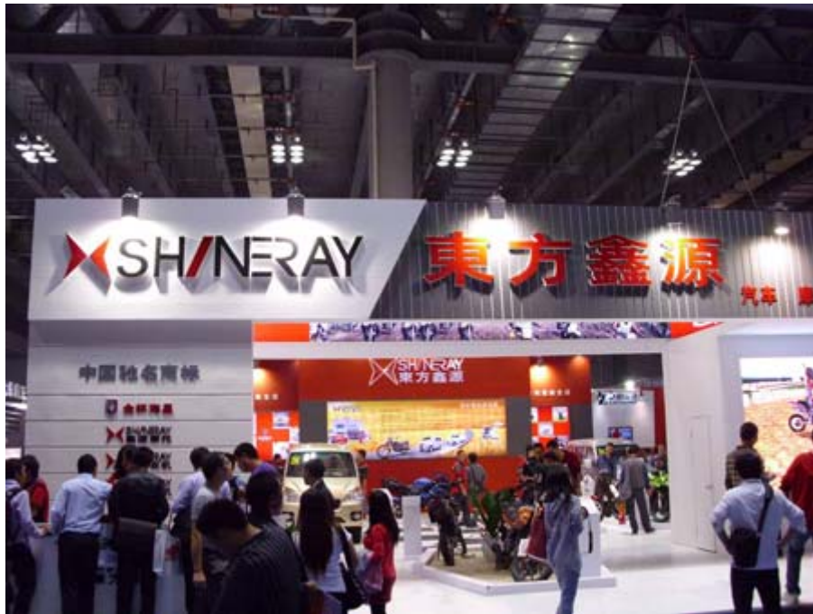
重慶東方鑫源展位