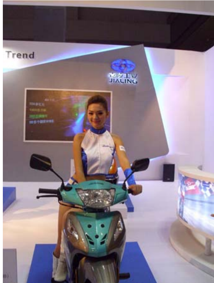
中國嘉陵工業展位