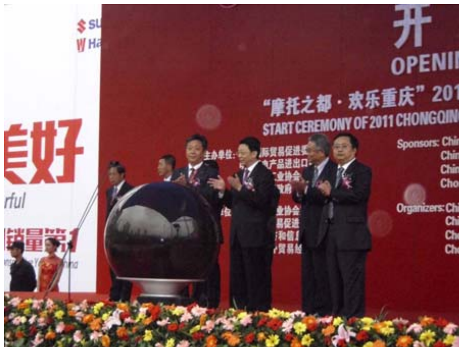
開展儀式由中汽協董揚常務副會長(左一)等貴賓按鈕啟動

本屆盛會國內外採購商及各大品牌參展商合計成交金額突破1億元人民幣，共計有10萬人次觀展，其中專業觀眾突破3萬人次。本屆展會不論從參展企業的數量和品質、展場面積和布展水準、觀展的經銷商、海外客商和國內售後市場買家人數、到會採訪的公眾媒體、專業媒體和海外媒體數量以及展會在國內外所受的關注及影響力均超越上屆，繼續保持了亞洲摩托車行業規模最大的專業展會的地位，同時也是全球最重要的交通工具摩托車博覽會。