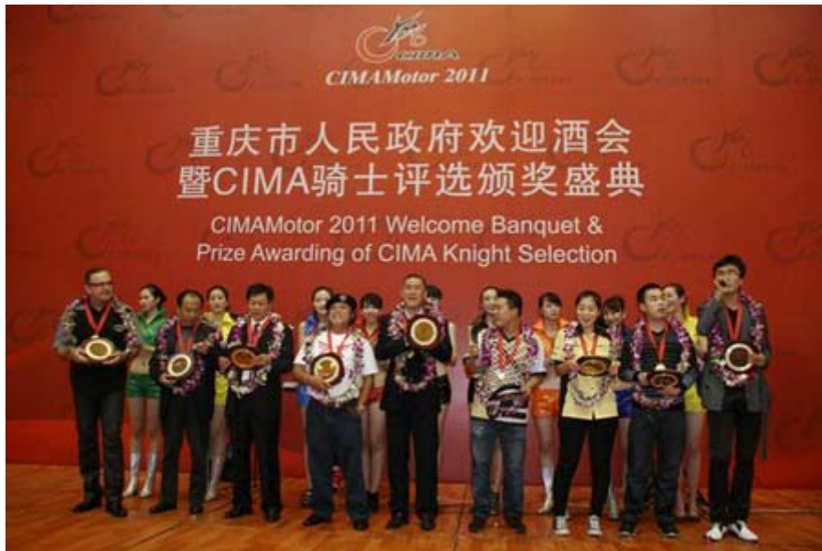
重慶市政府歡迎晚宴暨 CIMAMotor 騎士頒獎盛典