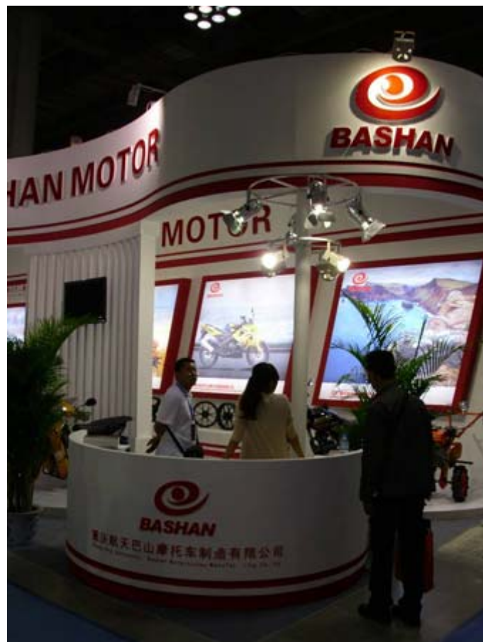
重慶航天巴山摩托展位