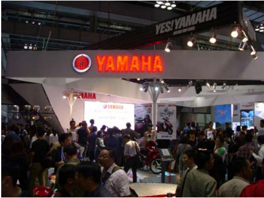
日本 YAMAHA 山葉(雅馬哈)展位