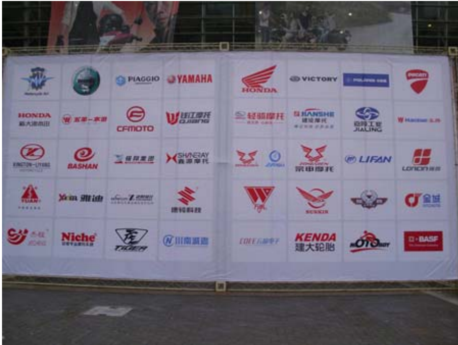
本屆主要參展品牌