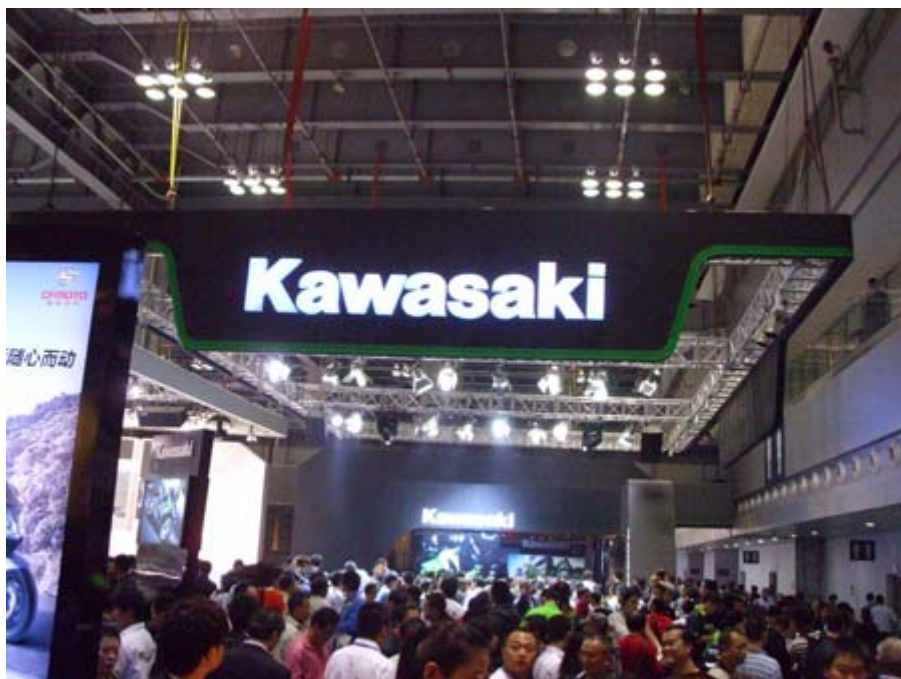
日本 Kawasaki 川崎展位