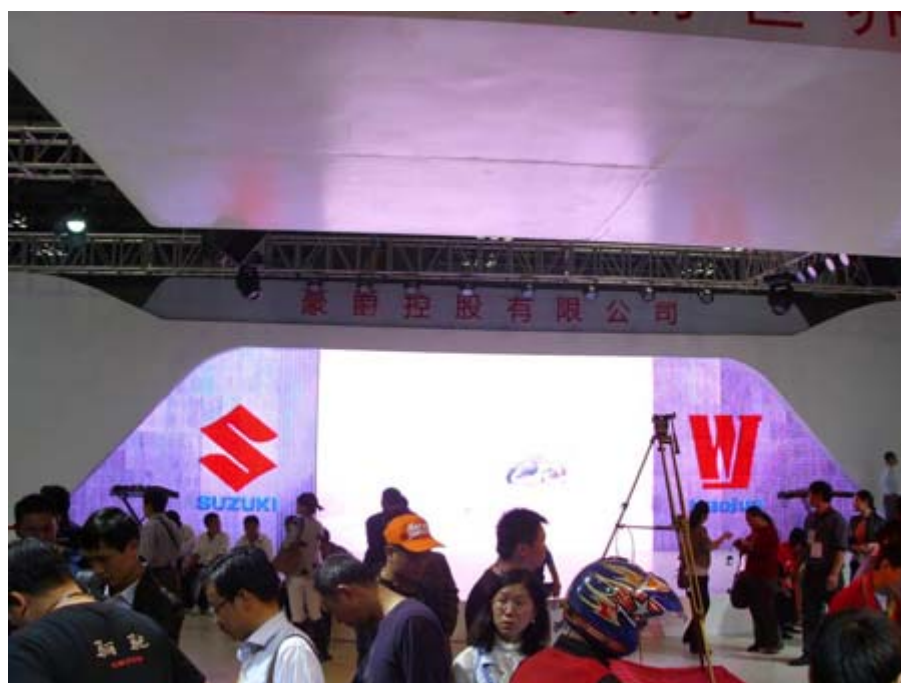
江門大長江(豪爵/鈴木)展位