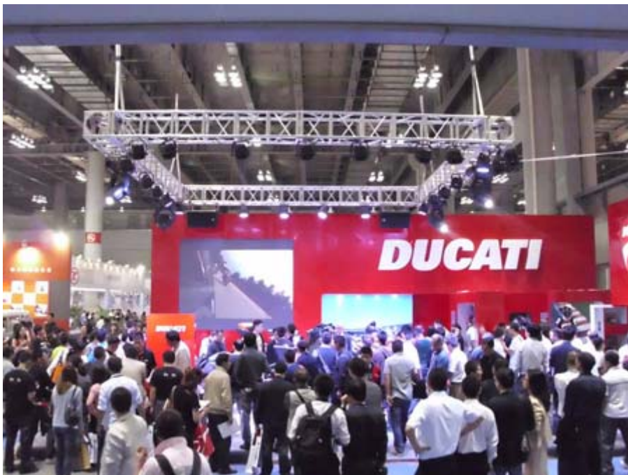
利大利 Ducati 杜卡迪展位