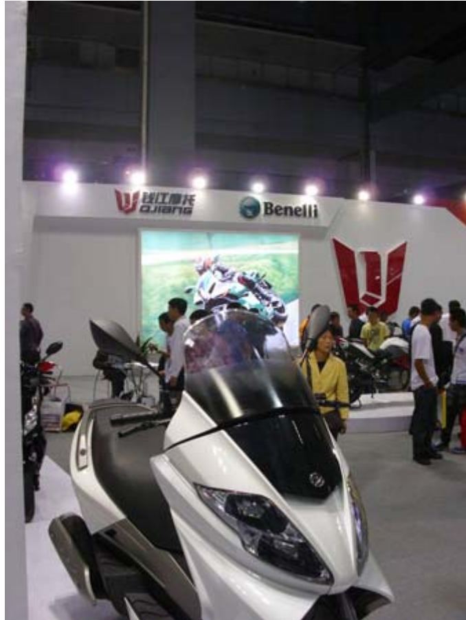
錢江摩托及義大利貝納利(Benelli)展位