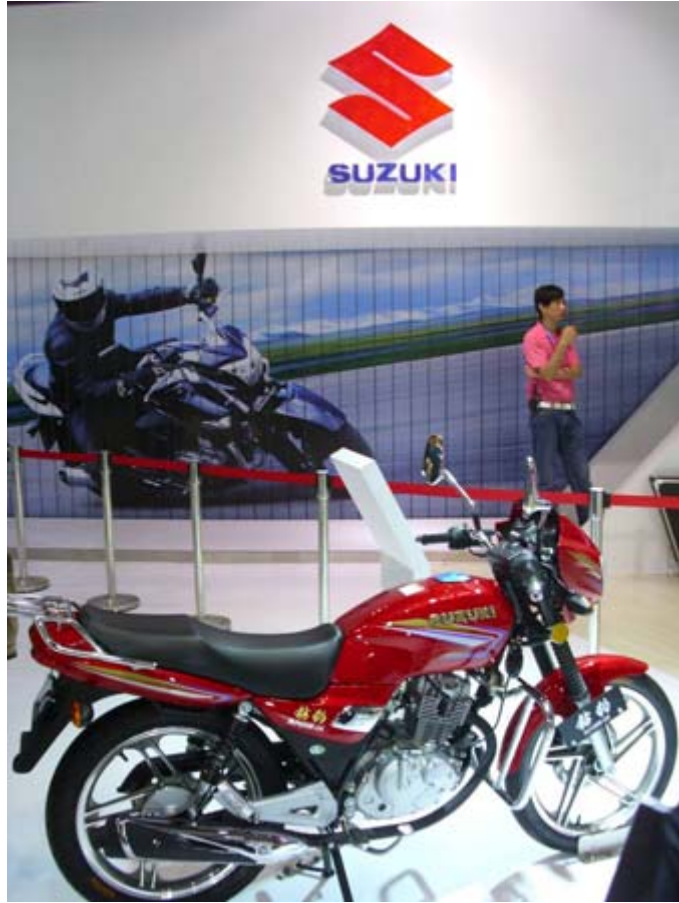
日本 SUZUKI 鈴木展位