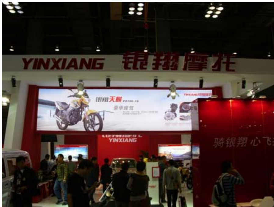
重慶銀翔摩托展位