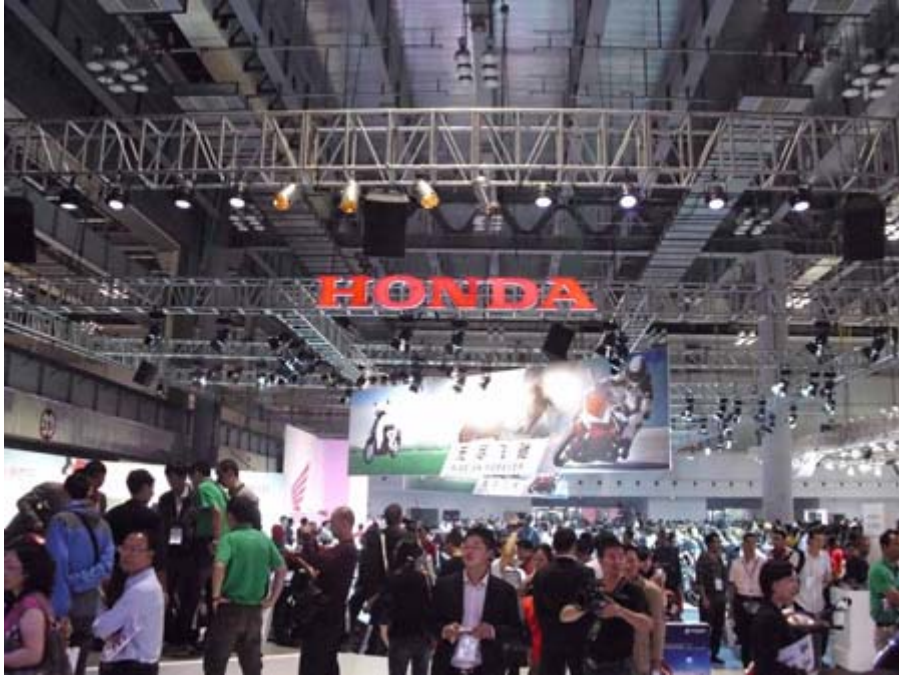
日本 HONDA 本田展位