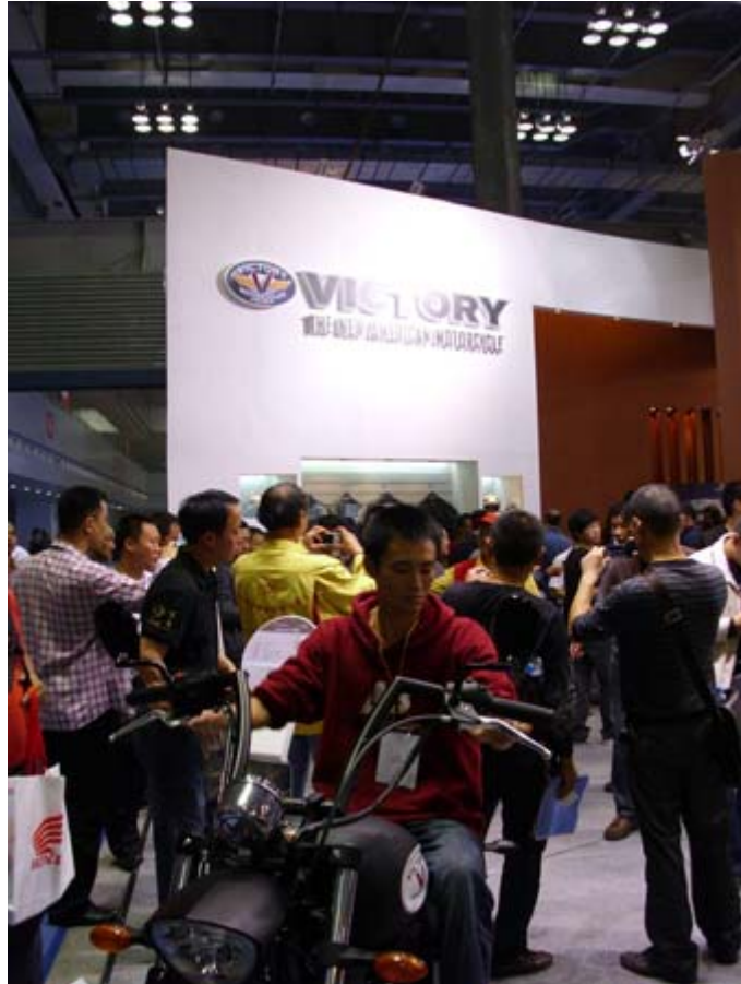
美國 Victory 勝利展位