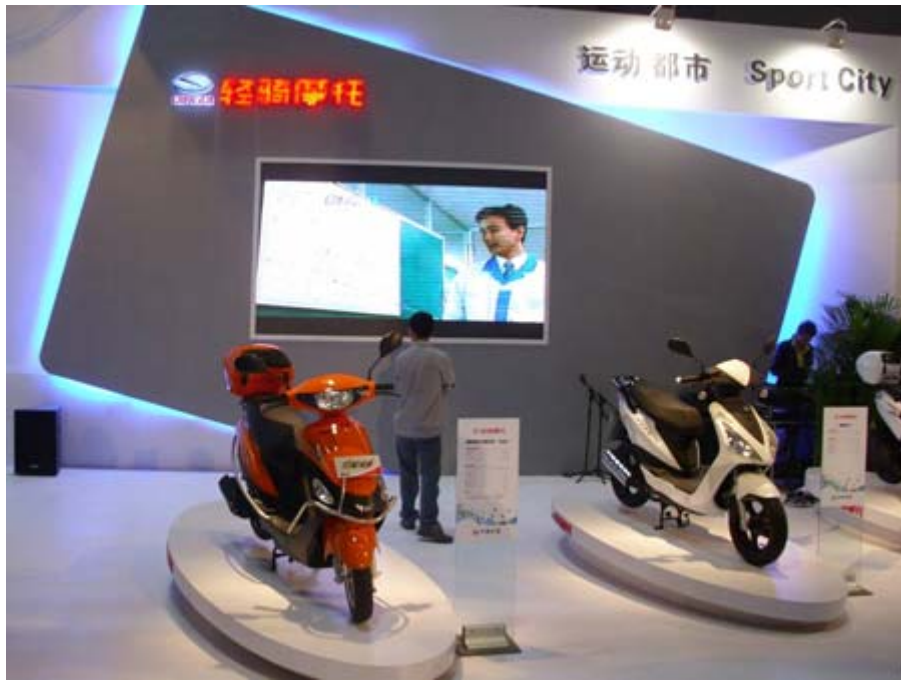
濟南輕騎摩托展位