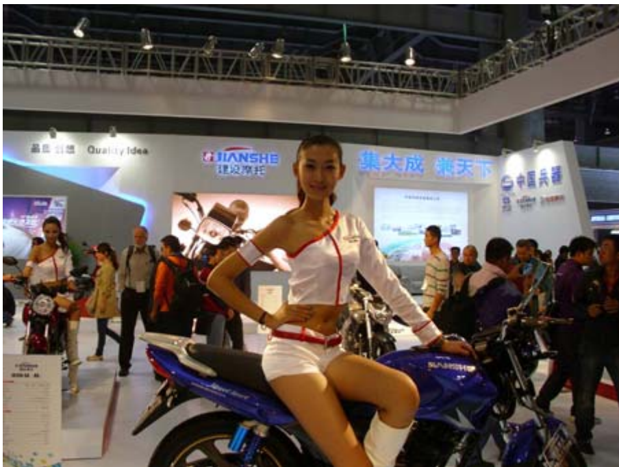
重慶建設摩托展位