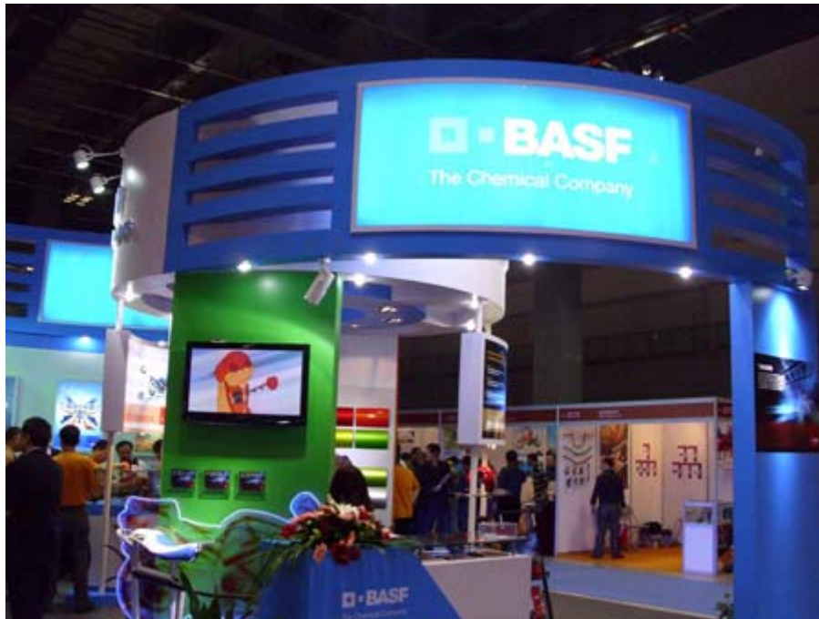
巴斯夫 BASF 展位