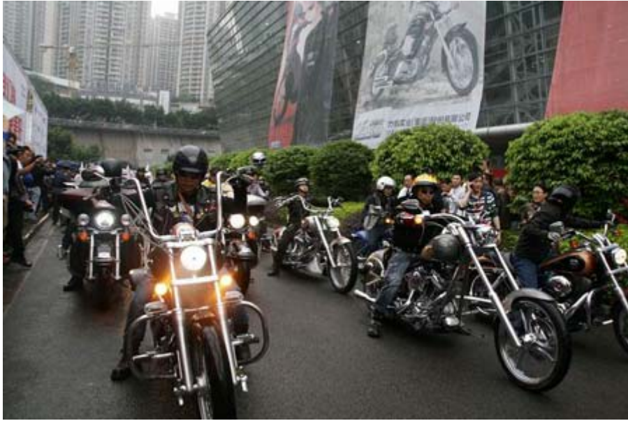
“摩托之都•歡樂重慶”2011 重慶國際摩托車騎行活動