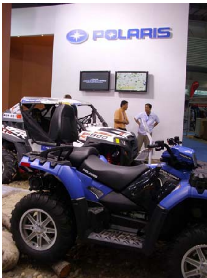
美國 Polaris 北極星展位