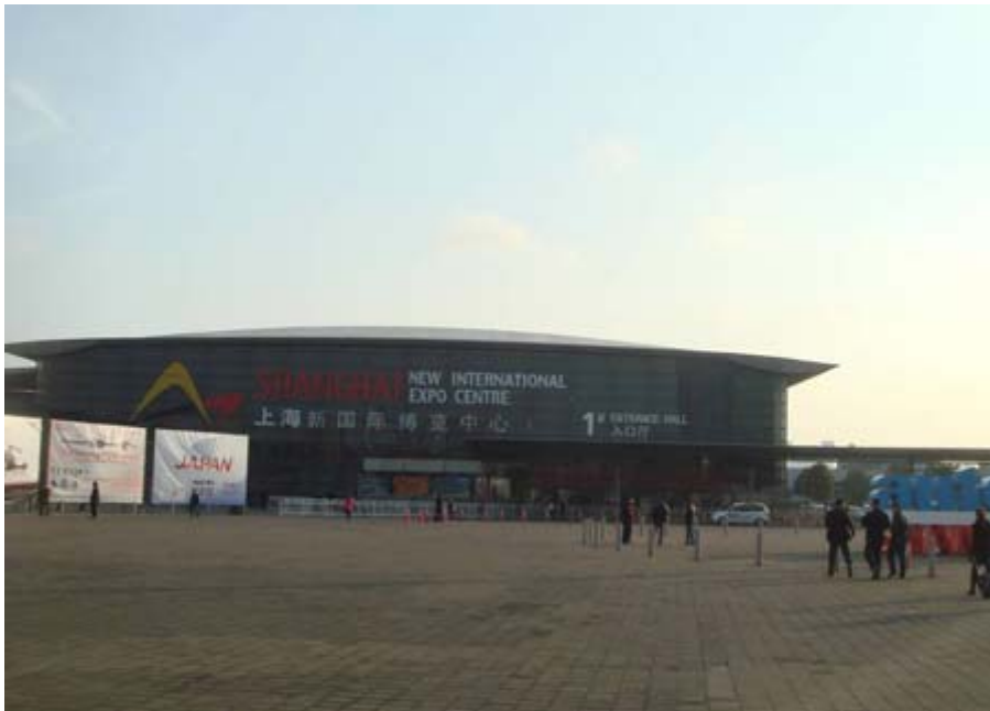
展覽於上海浦東新國際博覽中心舉行

「2011 年上海國際汽車零配件、維修檢測診斷設備及服務用品展」(Automechanika Shanghai) 於 12 月 7 日至 10 日連續四天在上海新國際博覽中心盛大舉行，由法蘭克福展覽(上海)有限公司和中國汽車工業國際合作總公司共同主辦，每年舉辦一次，自 2004 年起已連續舉辦 7 屆，今年展覽共有來自全球 36 個國家、3,619 家廠商參加展覽，與去(2010)年相比較，參展廠商成長 16%，中國大陸有 3,273 家廠商參展，海外廠商有 346 家參展，台灣全部有 98 家廠商參展，本次展覽有美國、德國、法國、義大利、西班牙、日本、韓國、泰國、馬來西亞、印度、新加坡和台灣等 12 個國家以國家館展出，印度和日本也首度以國家館組團參展，共使用 13 個室內展館及 6 個室外展館，展出面積達 16 萬平方公尺，為亞洲最大的汽車零配件展覽會。