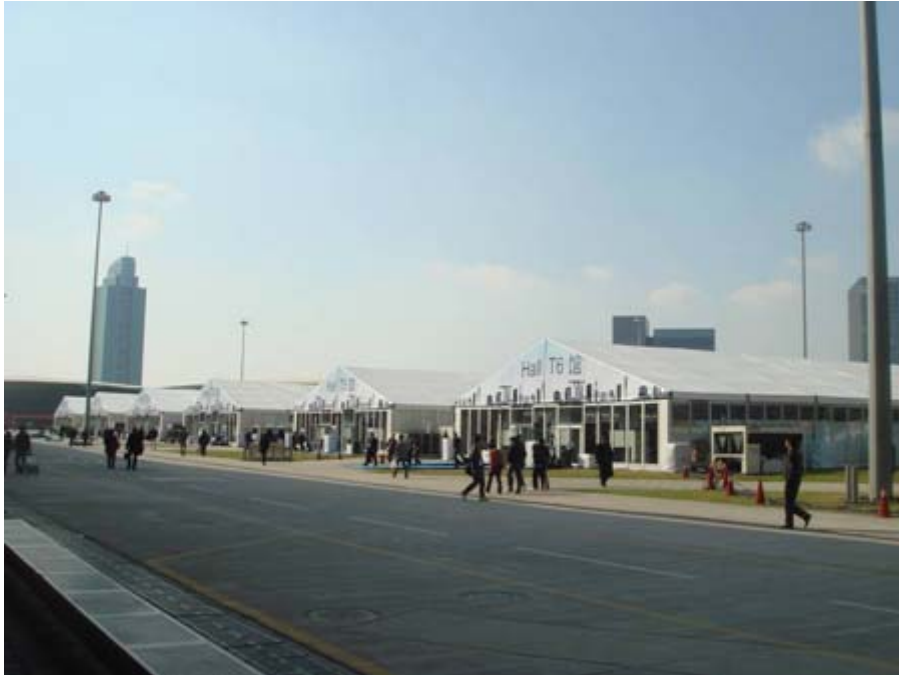
展覽館面積廣闊，戶外展館一隅