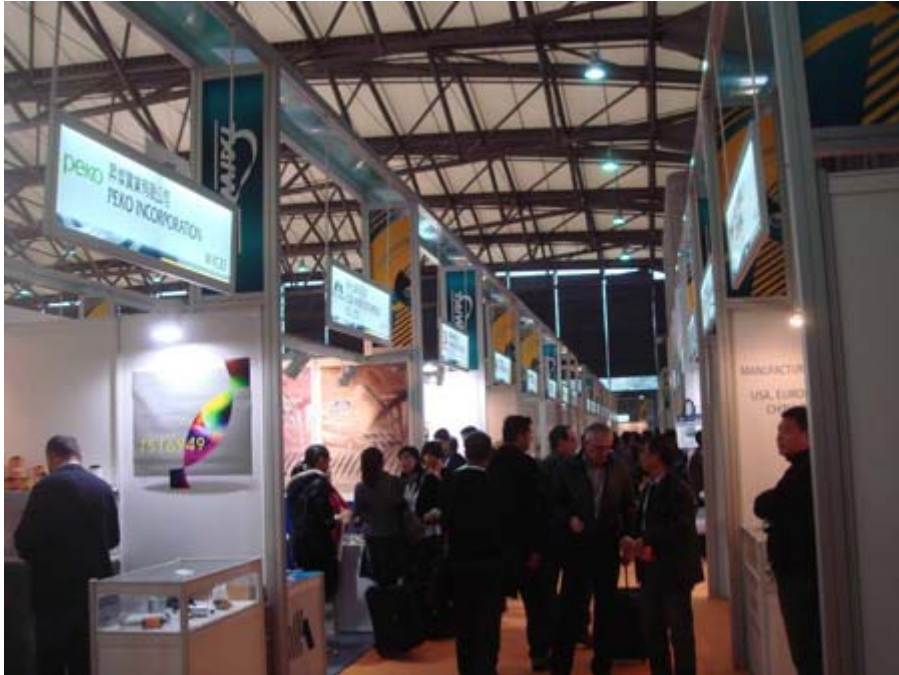
買主參觀 W1 館台灣館