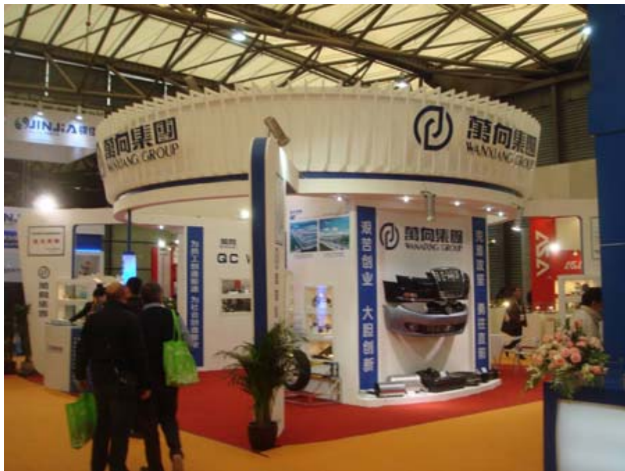
中國大陸參展廠商