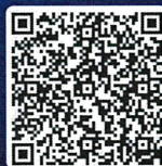
下午場 (產業菁英場)

地點 桃園會展中心 會議棟GF樓層 G02會議室 桃園市中壢區領航北路一段99號