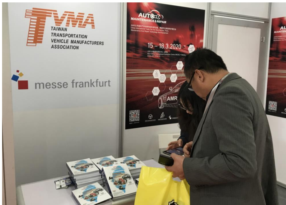
買主至車輛公會服務攤位詢問台灣汽車零配件產品資訊(二)

此外，德國企業首次以國家形象館形式於本展集體亮相，本屆展會得到眾多海內外知名品牌的鼎力支持，展品更加全面豐富，為供需雙方提供更多商機並能夠與海外市場具有影響力的國際品牌建立聯繫。