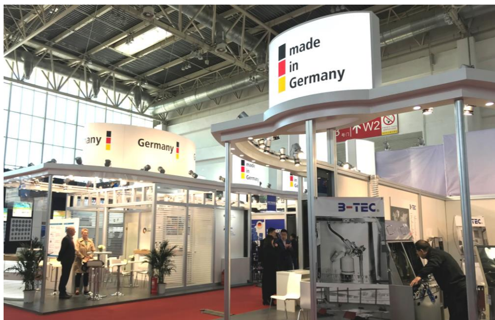
德國企業首次以國家形象館形式於本展集體亮相

除了參展廠商的產品展示外，展會期間還有 30 多場研討會及論壇活動精彩上演，緊貼時下熱門主題展開深入探討，包括 2019 中國汽車服務業新趨勢大會、潤滑油與汽車後市場供應鏈發展高峰論壇、2019 中國汽配經銷商發展論壇、環保趨勢下汽修行業新選擇、輪胎管道行銷提升價值論壇、新能源發展與汽車後市場等話題，替與會者展現全面汽車售後服務市場發展新契機和產業趨勢。