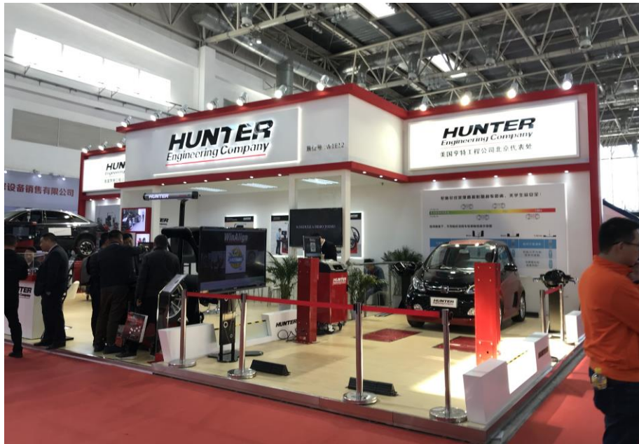
美國 HUNTER 維修設備公司攤位一隅