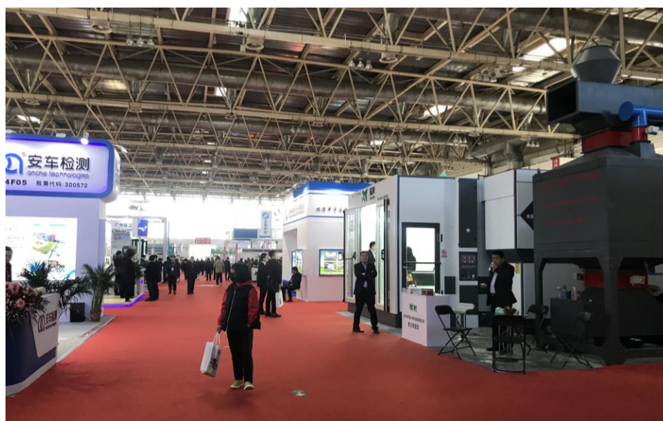
汽車鈹金/烤漆設備館