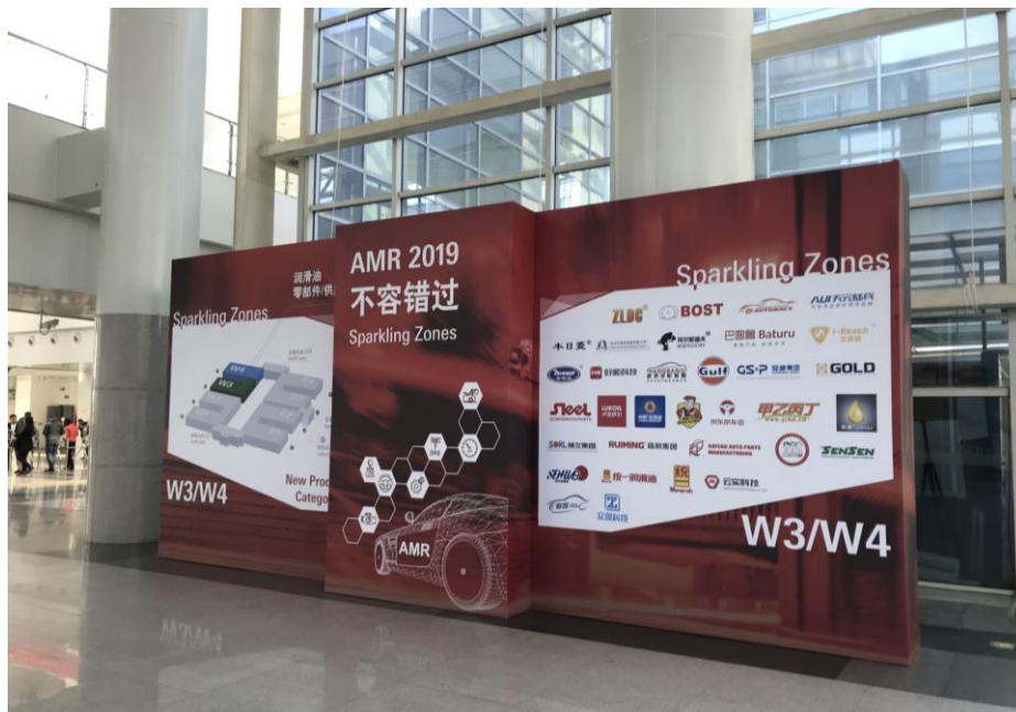
大會參展廠商平面圖

今年車輛公會籌組參展團的廠商共計 6 家，名單於文末所附。為積極服務參展廠商及買主，本會在會場特設置一個攤位提供買主洽詢及廠商服務，並發送會員廠商名錄之實體書及隨身碟，協助會員廠拓銷台灣優質形象的車輛零配件產品，本展後緊接著台北國際汽車零配件展，許多前來車輛公會服務攤位索取會員資料的買主表示也會到台北展參觀展覽，顯見台灣與中國大陸的汽車產業關係緊密。