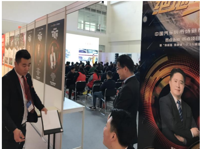
大會舉辦活動花絮