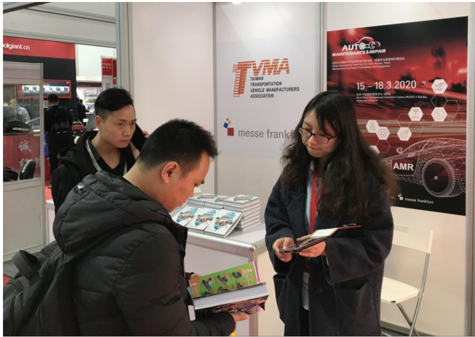
買主至車輛公會服務攤位詢問台灣汽車零配件產品資訊(一)