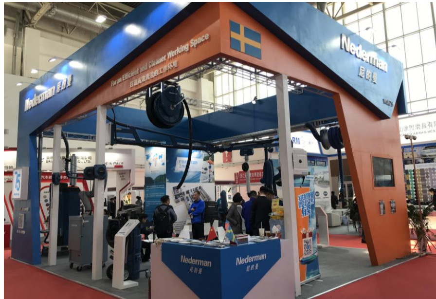
瑞典 Nederman 維修設備公司攤位一隅