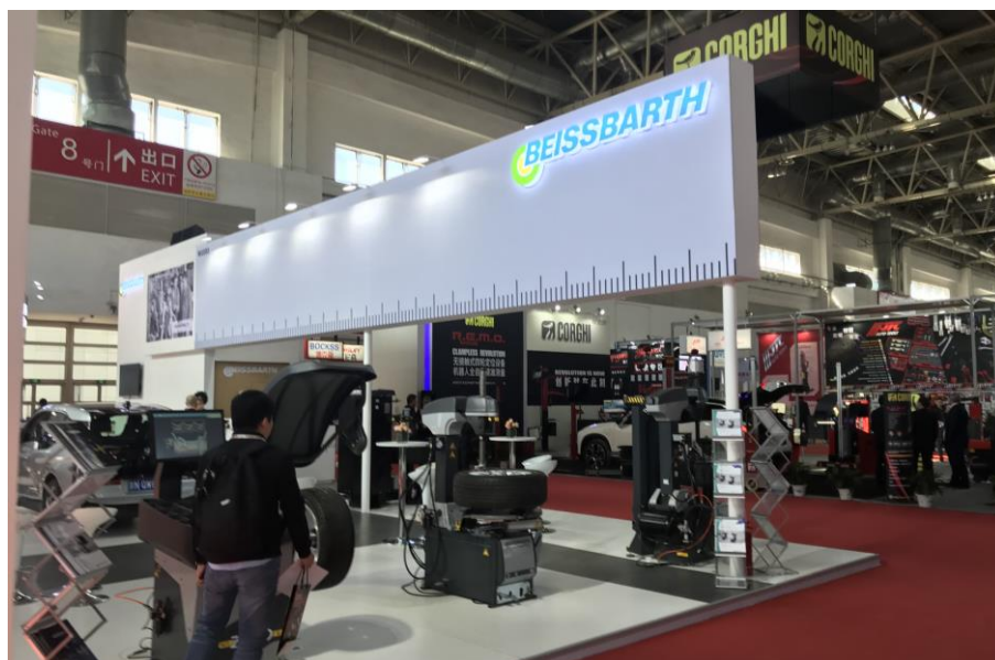
德國 Beissbarth 維修設備公司攤位一隅

中國大陸人口總數達到 13.9 億人，占世界人口總量 18.29%，居世界首位。2018 年全年，中國大陸貨物貿易總值共計美金 46,004 億元(2017 年為 40,692 億元)，比去年約成長 13%，似乎受中美貿易戰的影響不大，但未來中國經濟發展走向如何是未見定數。國家主席習近平於 2018 年博鰲亞洲論壇年會開幕式演講時表示，中國大陸將擴大開放，主要是：大幅度放寬市場准入、創造更有吸引力的投資環境、加強智慧財產權保護、主動擴大進口，其中與車輛產業最直接相關的是「大幅度放寬市場准入」裡針對製造業的目標，目前已基本開放，保留限制的主要是汽車、船舶、飛機等少數行業，下一步要儘快放寬外資股比限制，特別是汽車行業外資限制，不啻是替車輛產業注入一股活水。