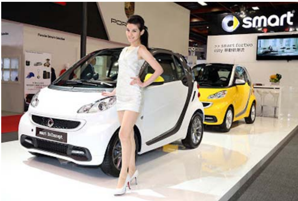
Smart Bo Concept