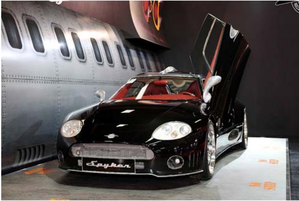
荷蘭 Spyker 超跑 C8 Laviolette 首度來台亮相，融合車輛航空賽車領域