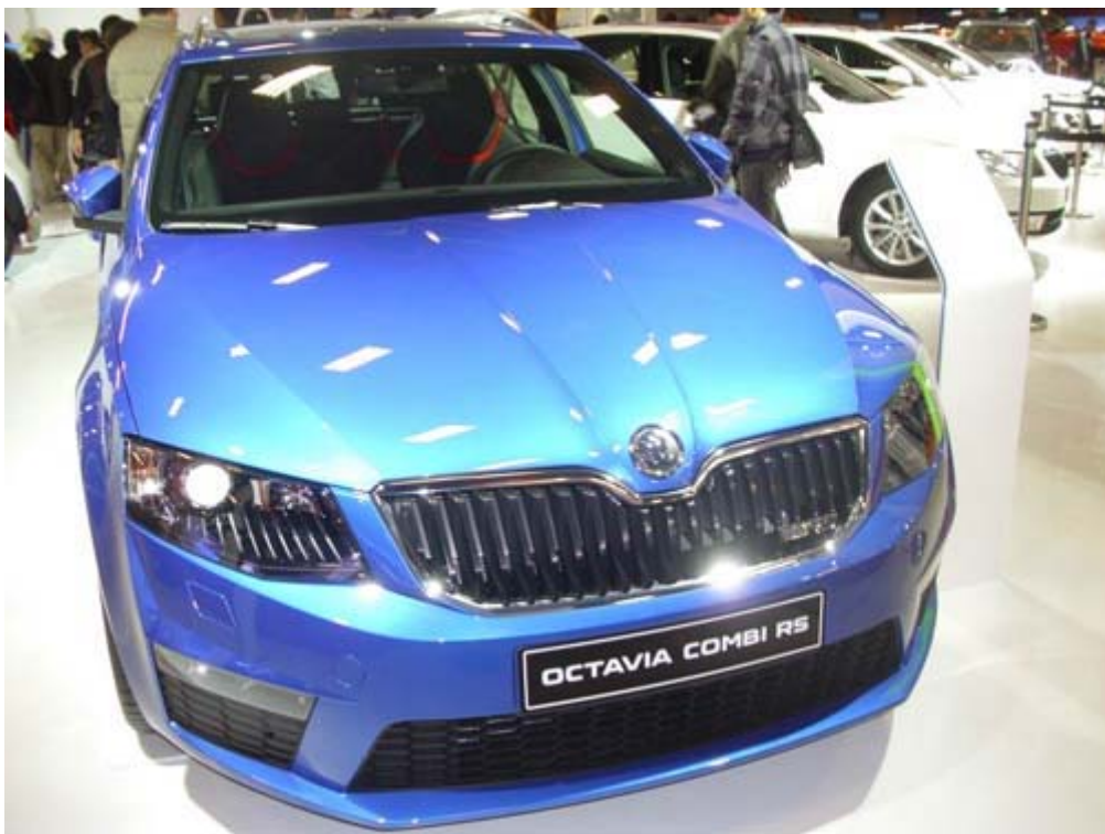
全新 MQB 平台 Skoda Octavia Combi RS