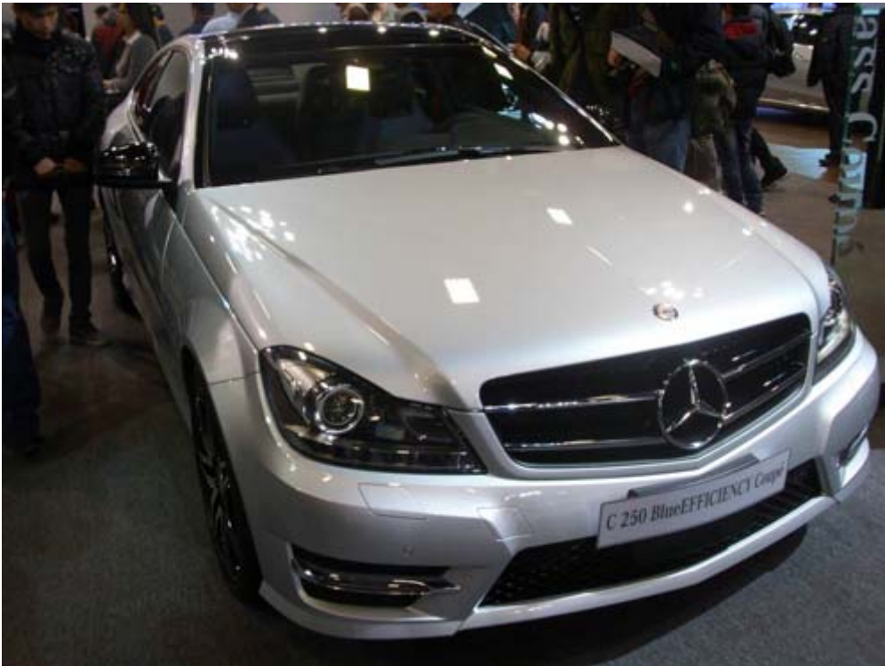
M-Benz C-Class 是台灣進口車內銷量前十名之一