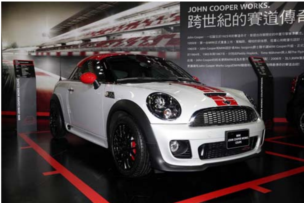
Mini John Cooper S Works Family