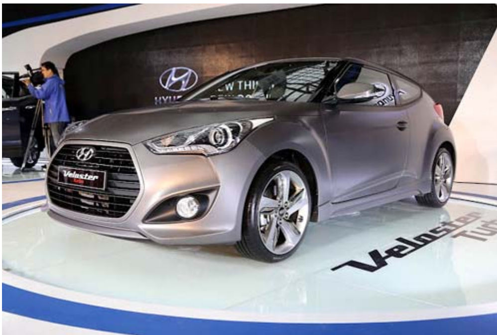
個性鋼砲 Hyundai Veloster Turbo，四缸 1.6L GDI 引擎，最大馬力 208 HP ( 6,000 rpm)，最大扭力 195 lbs-ft (1,600 rpm ~ 5,000 rpm)