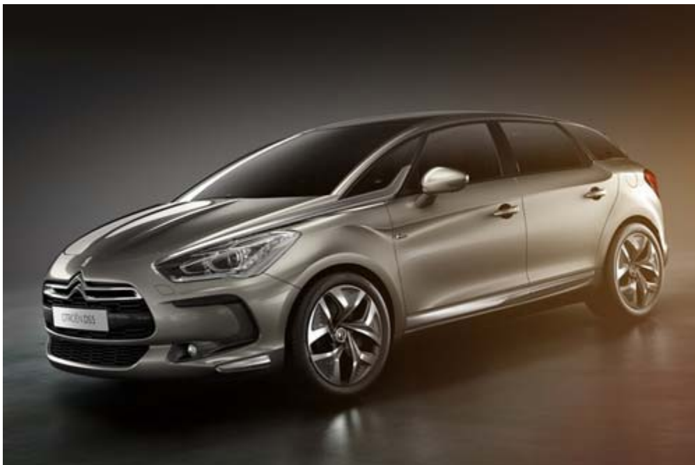
Citroen 重返台灣首發車款 DS5 排氣量 1,598c.c.，峰值出力 120kw/6000rpm，峰值扭力 240Nm/1400rpm，6 速手自排變速箱， 0-100km/h 9.7s，極速 202km/h