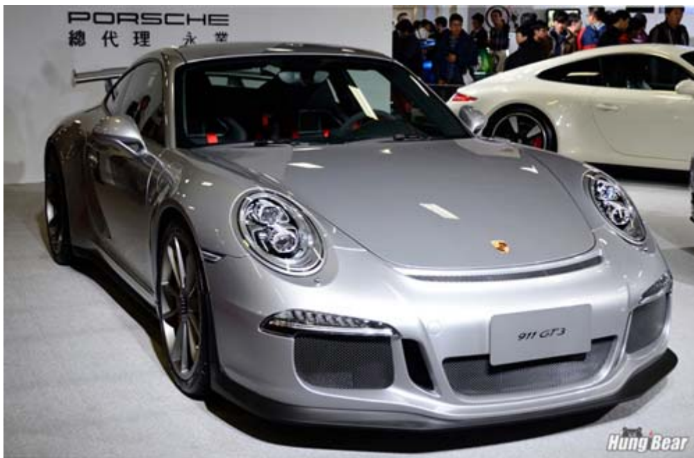
Porsche 911 GT3