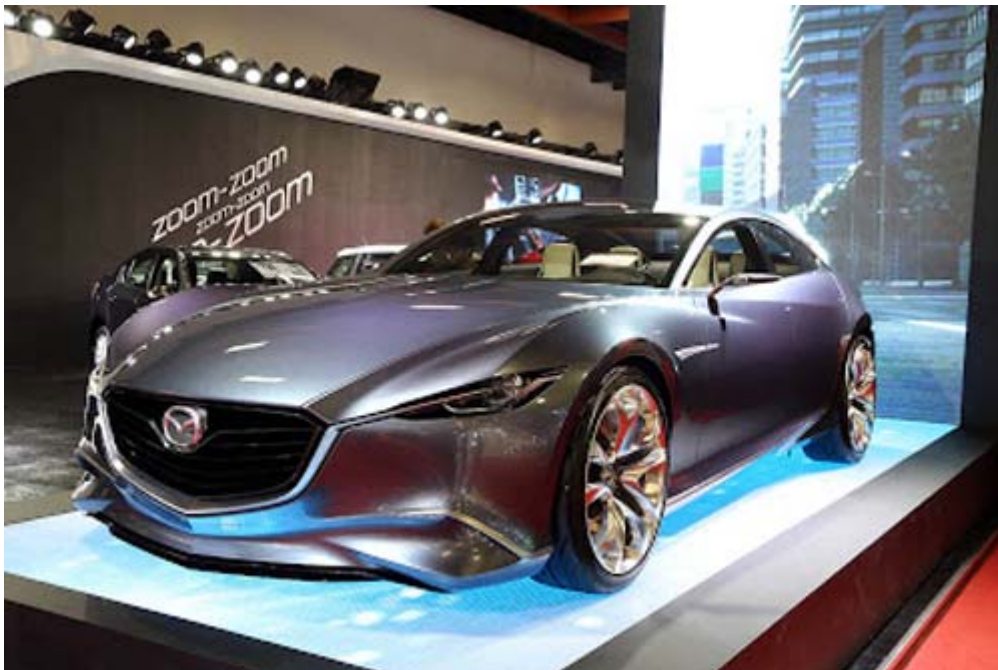
Mazda 概念車 Shinari，概念「Kodo 動」是 Mazda 品牌邁入 第六世代的全新設計主軸