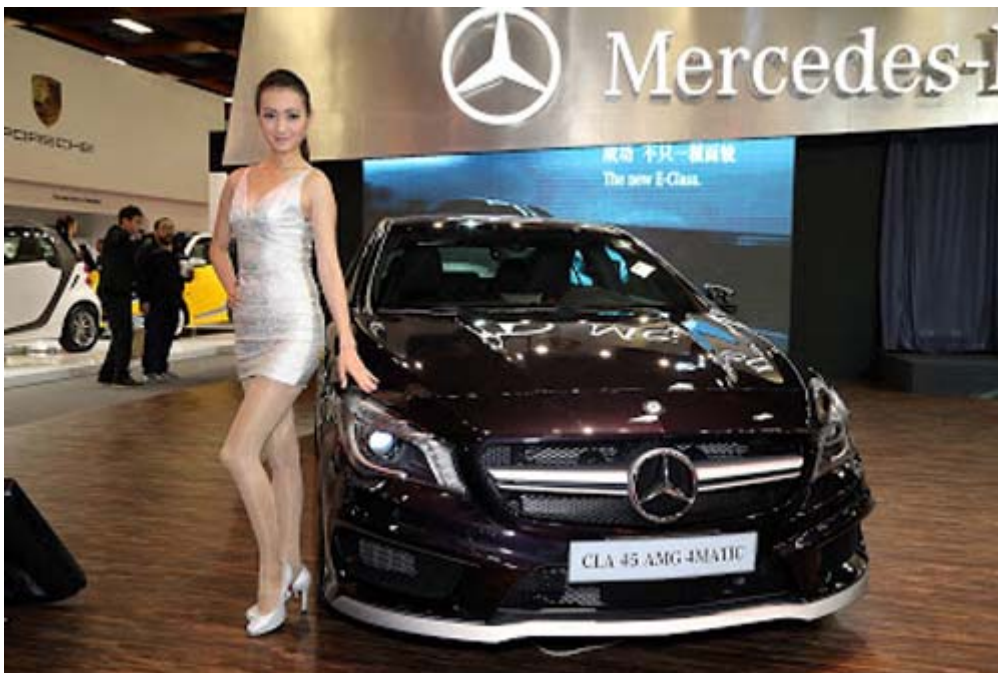
M-Benz CLA45 AMG 4MATIC