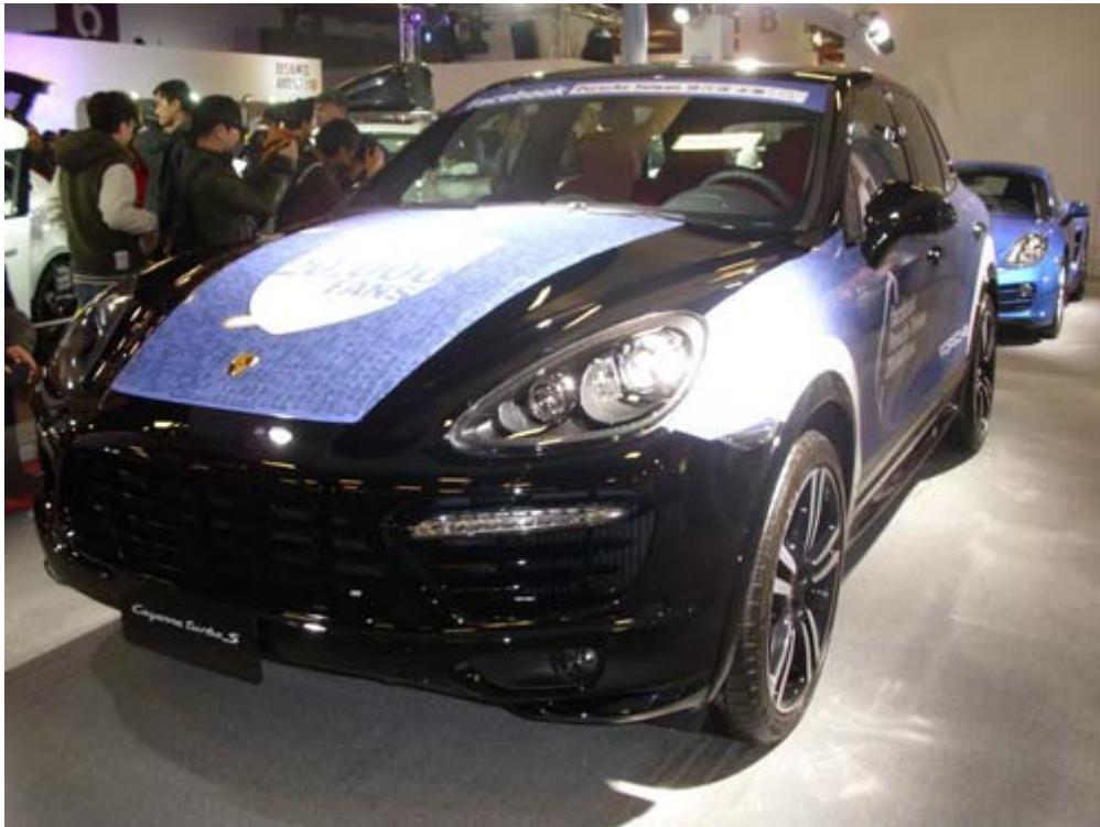
最具競爭力跑格小休旅車 Porsche Macan Turbo