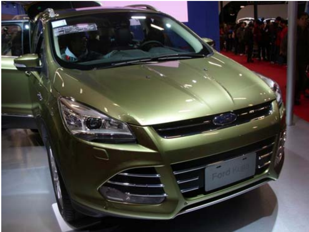
國產化的福特六和汽車 Kuga