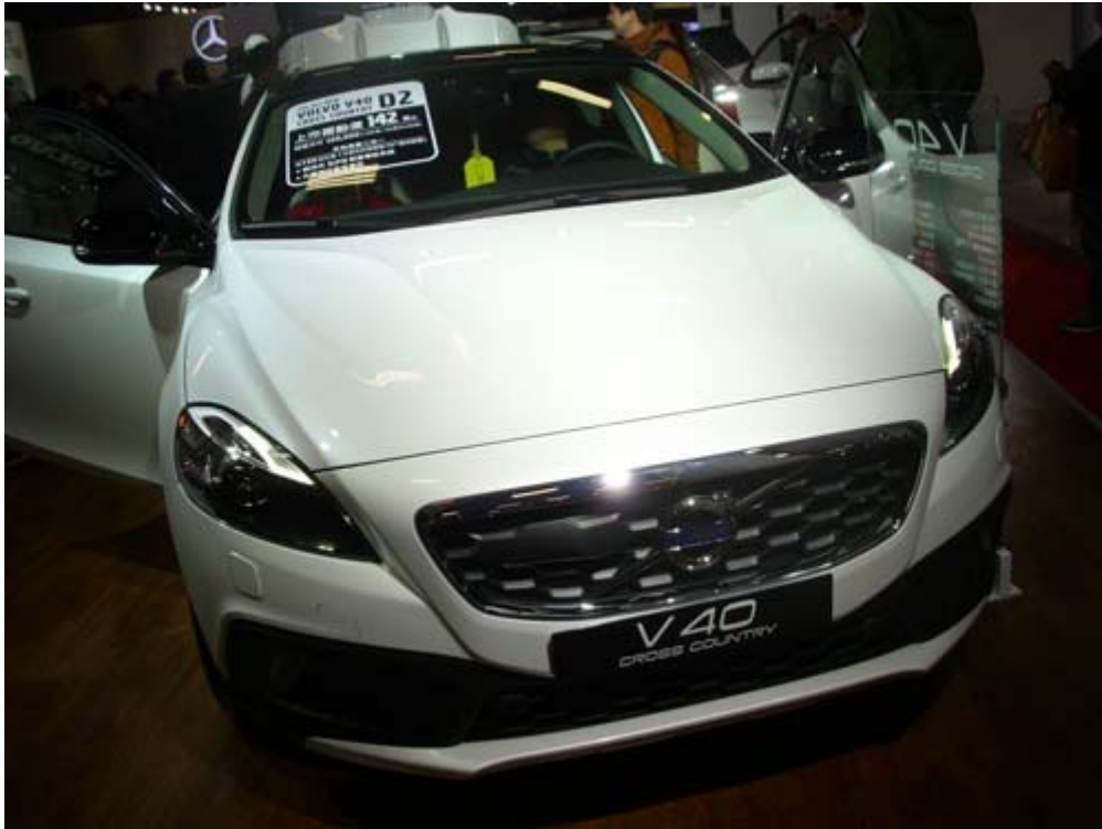
Volvo V40 Cross Country，最大馬力 187kW， 最大扭力 360Nm;6 速自排