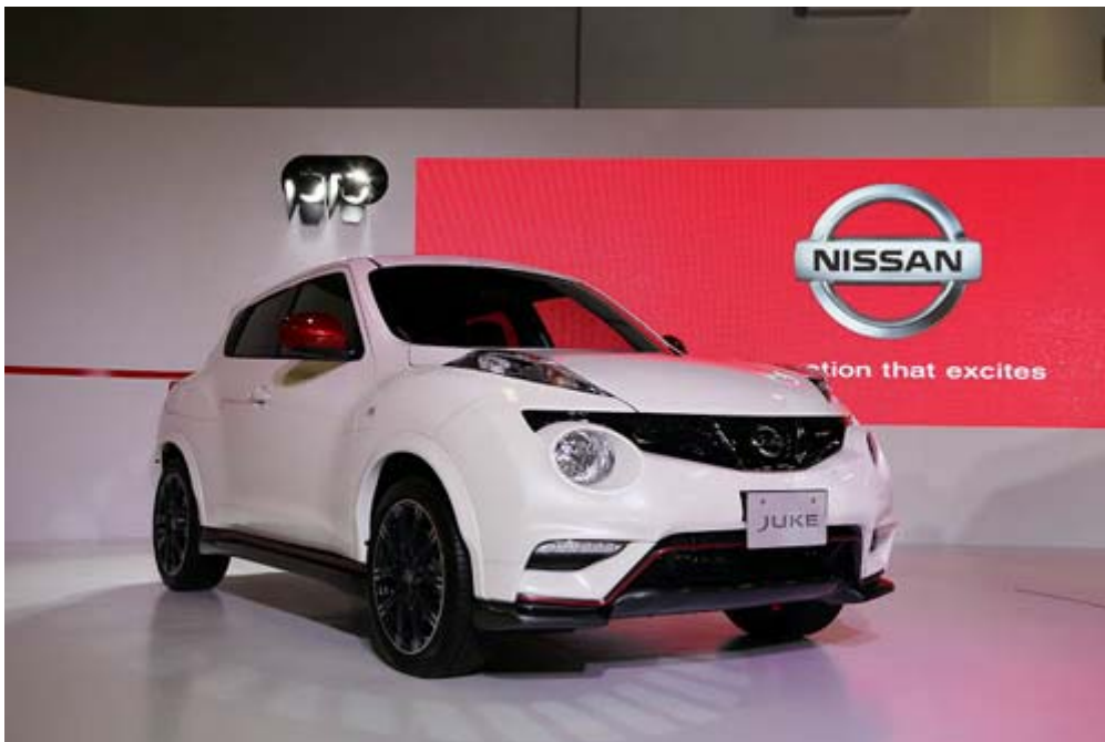
Nissan Juke Nismo

Citroen 重返台灣首發車款 DS3，四缸 DOHC 16V Turbo 引擎， 最大馬力 150hp@6,000rpm，最大扭力 240Nm(1,400-4,000rpm)， 平均耗油 6.7L/ 100km，6 速手自排變速箱，0-100km/h 加速 7.3s，極 速 190km/h / 214km/h