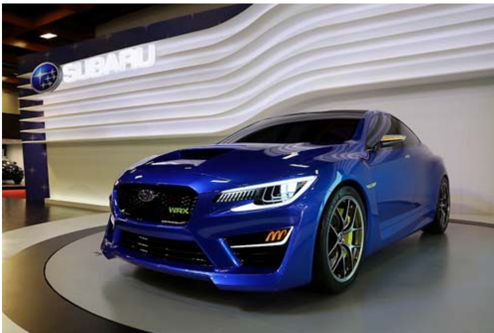
Subaru WRX Concept 顯示出下一代 Subaru WRX 的雛形， 顯示出 Subaru 性能房車未來之走向