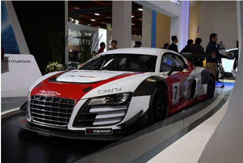
Audi R8 LMS Cup Car，是專為 Audi R8 LMS Cup 品牌統一規格賽所打造的原廠賽車