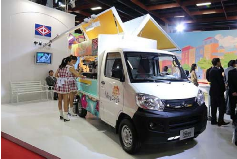
中華汽車自行設計開發改裝的中華菱利咖啡專賣車