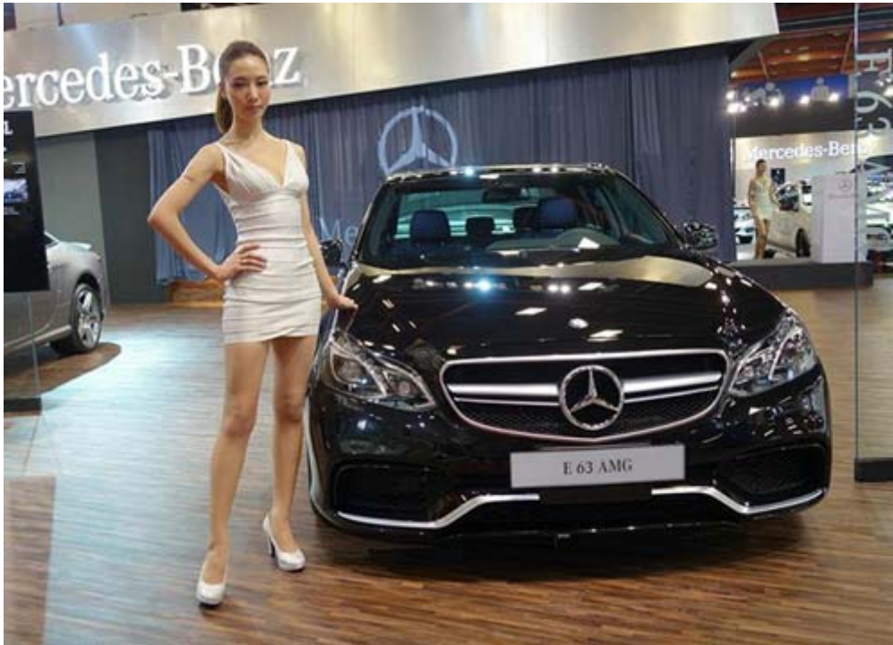
M-Benz E 63 AMG