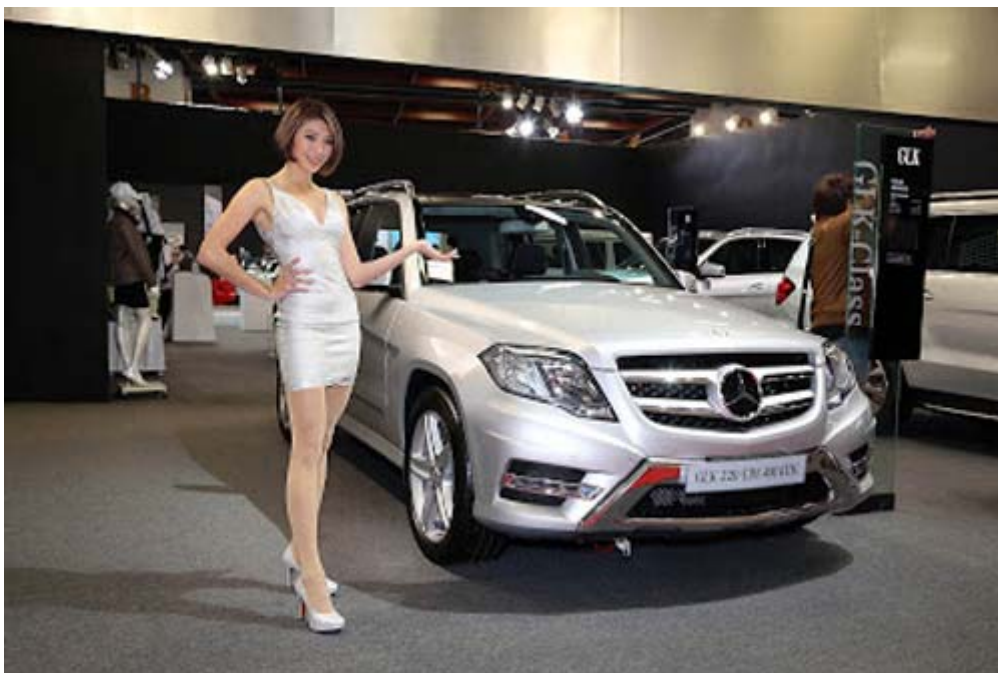
M-Benz GLK220 CDI 4Matic