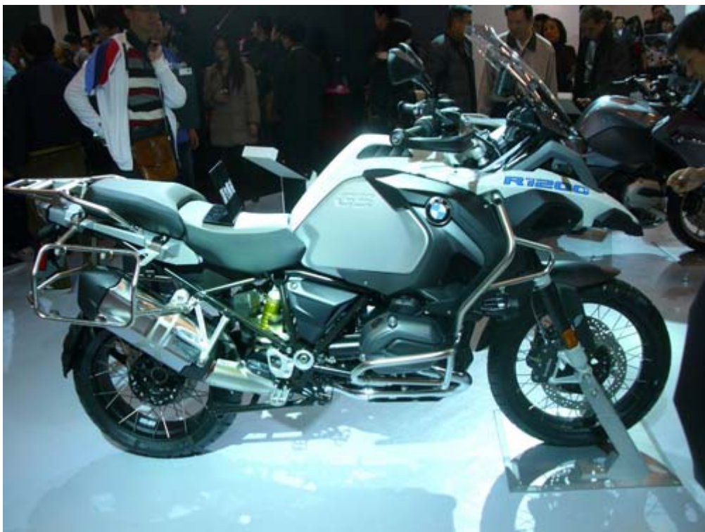
BMW R1200 重型機車