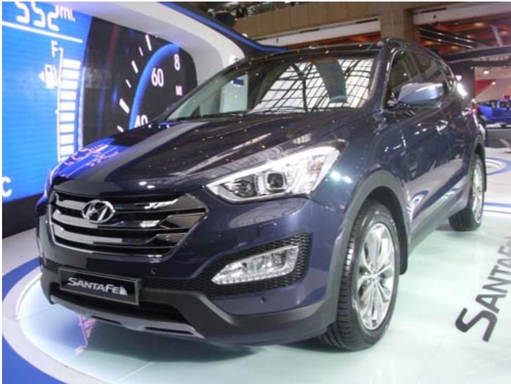
全新歐風動感 Hyundai New Santa Fe · 4 缸 2.2L turbo and intercooled DOHC 引擎 ，馬力 194hp (197PS) ，扭力 311 lb-ft (421Nm) ， 6 速手自排變速箱