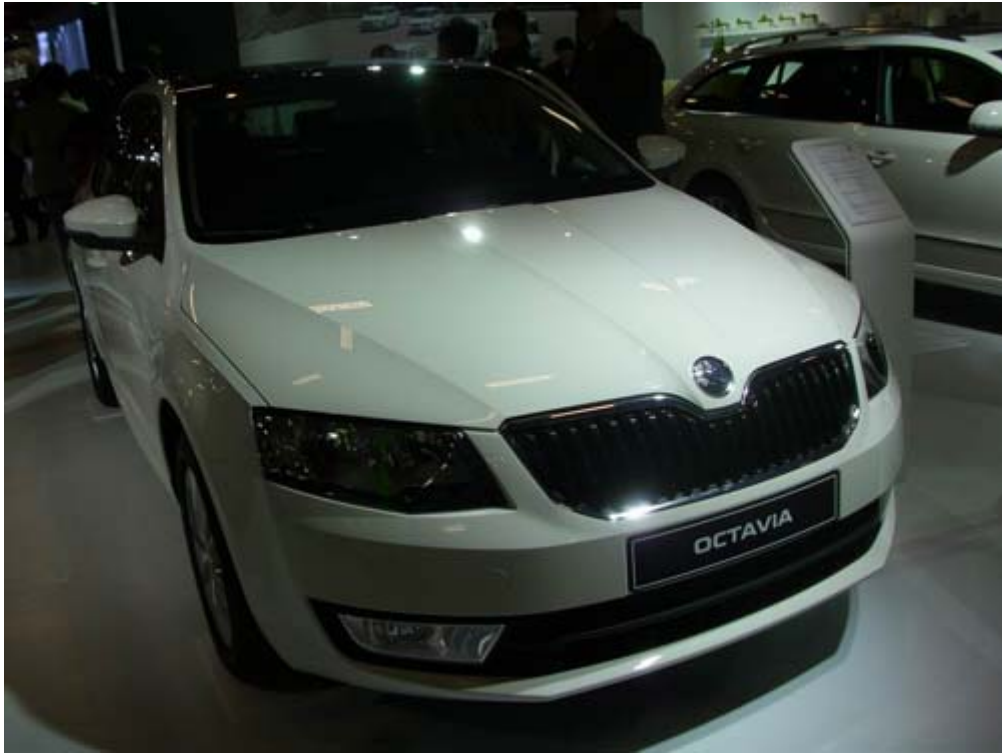
全新 MQB 平台 Skoda Octavia