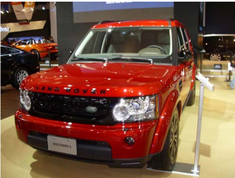
Land Rover Discovery 4