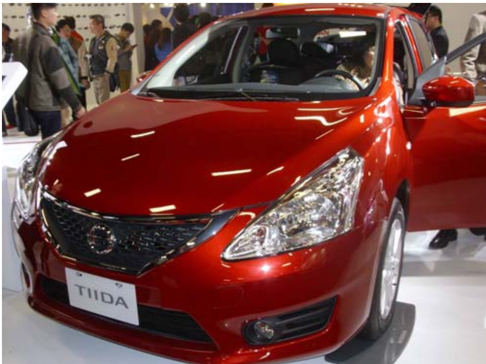
國產化的裕隆日產汽車 Tiida 為台灣內銷量前十名車款之一