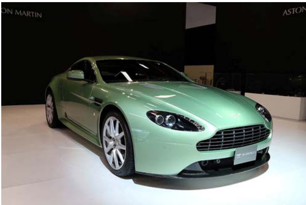
Aston Martin Vantage S