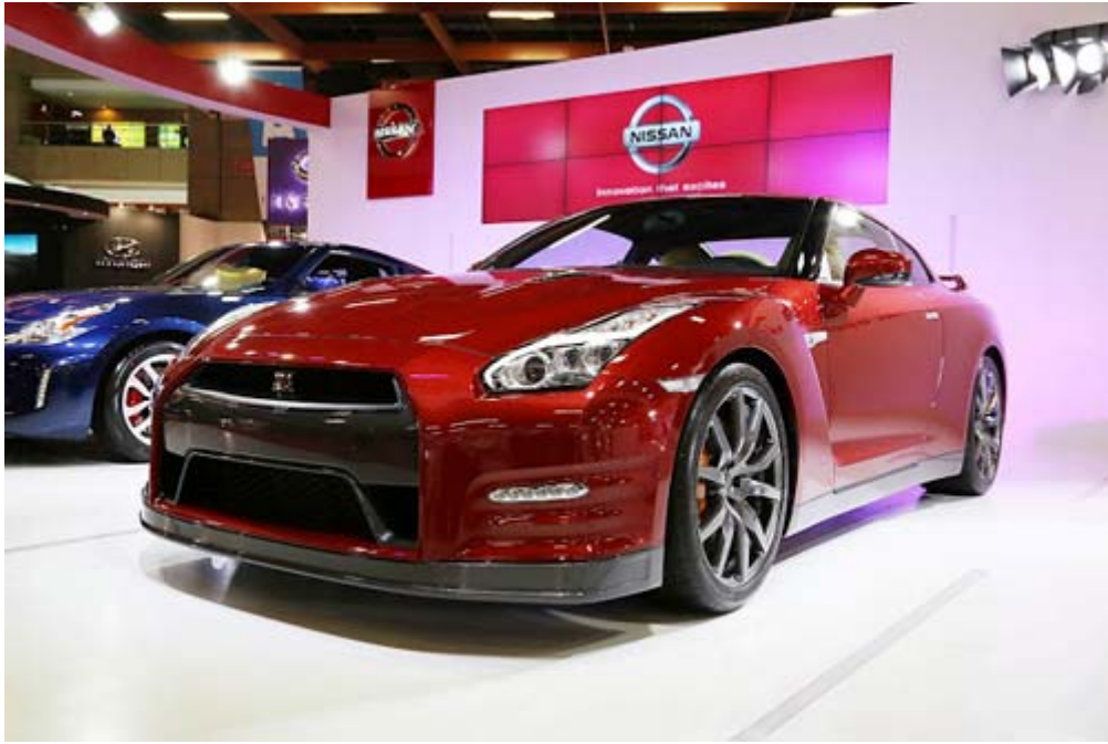
Nissan 超級跑車 GT-R，世界最快跑車， 東瀛戰神與[酷斯拉怪獸]的封號廣為車迷稱頌