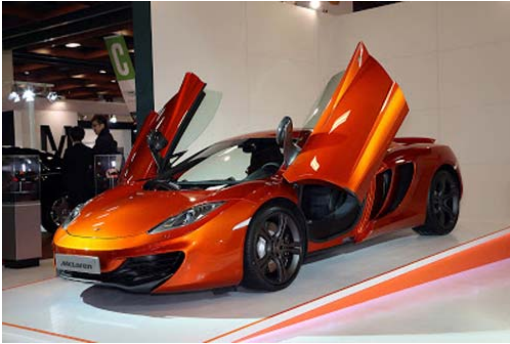
McLaren 首次參展 12C Coupe 50 週年限量版， 採用多 F1 賽車科技打造，全球僅 50 輛