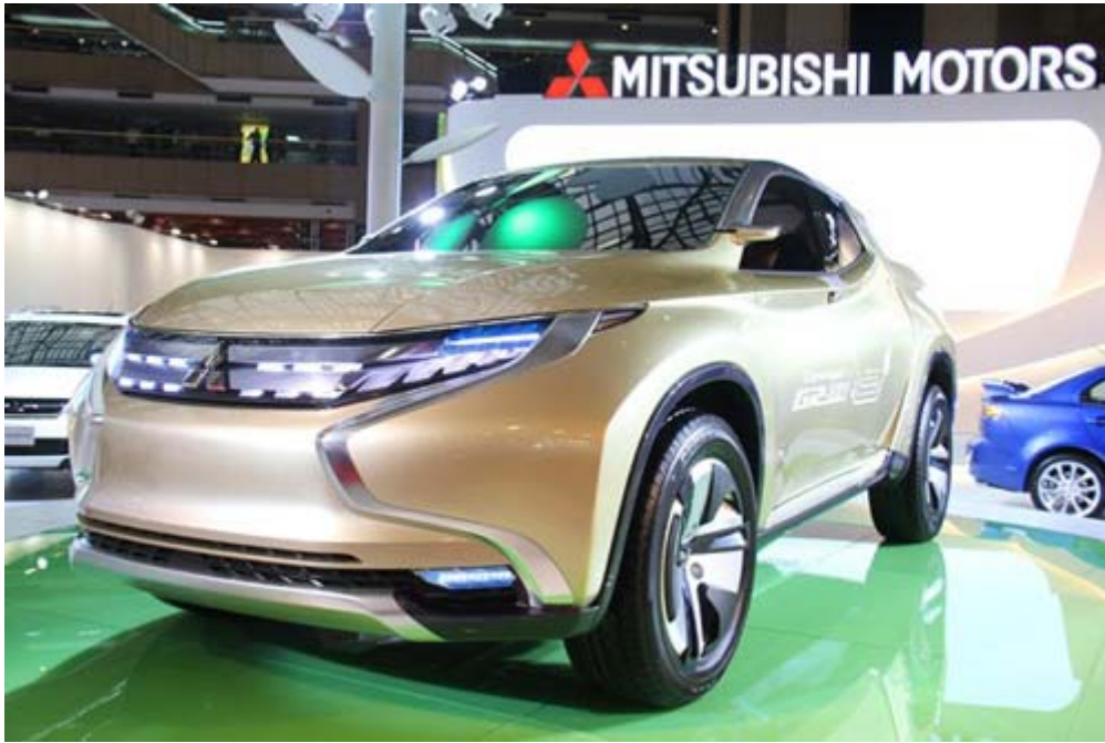
Mitsubishi GR-HEV 霸氣外觀搭配強悍性能，力與美結合的綠能概念車