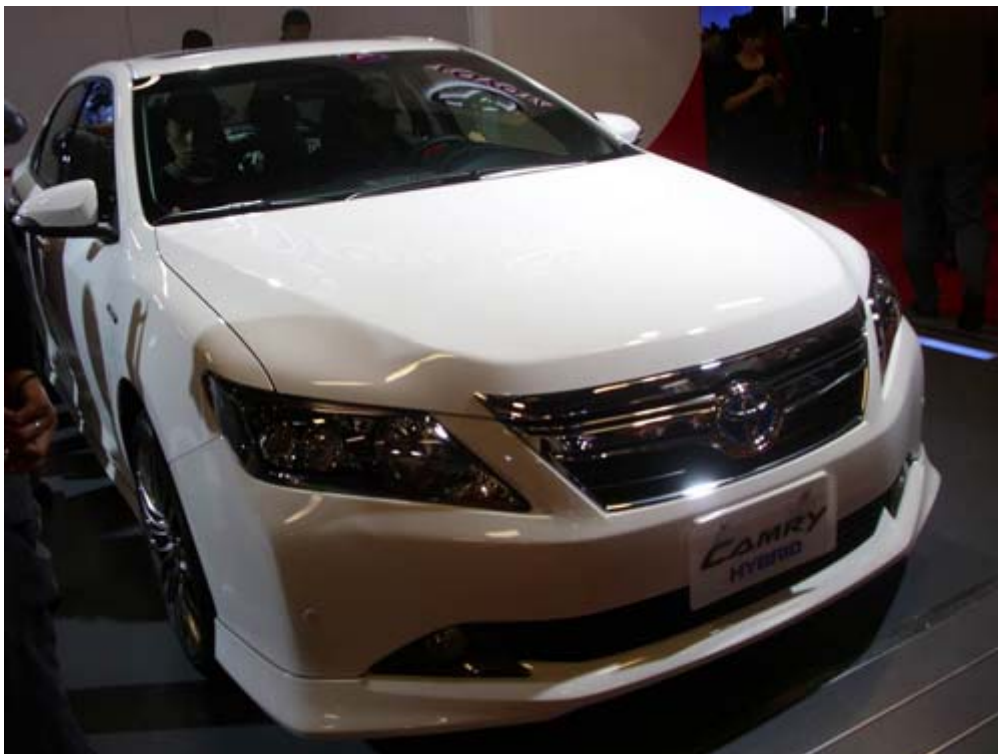
國產化的豐田國瑞 Camry HEV 油電混合車加上汽油車是台灣內銷量前十名車款之一