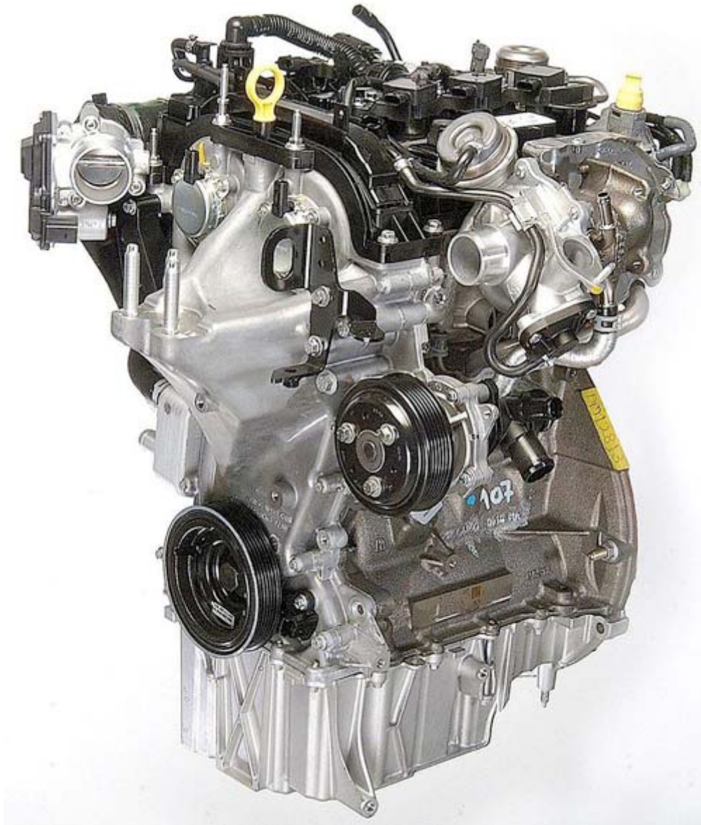
Ford 1.0L EcoBoost 的引擎為 1.0L I3 turbo 節能效率引擎， 榮獲國際引擎大賞的「年度最佳引擎」