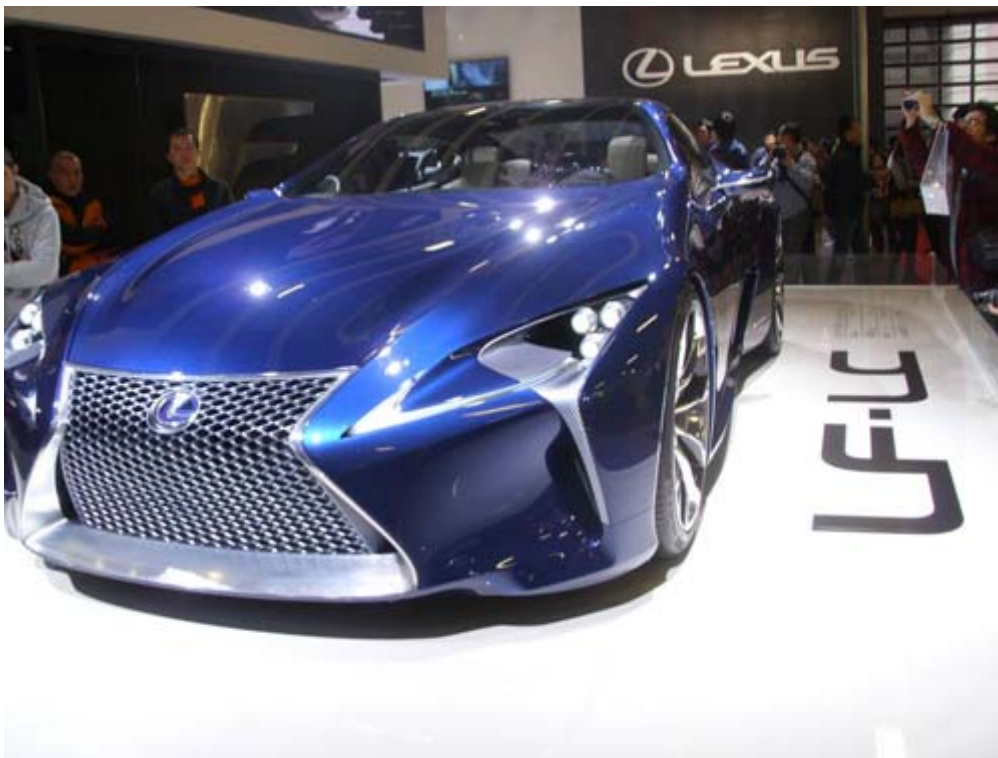
LEXUS LF-LC，繼 LFA 超跑之後，一部劃時代的油電複合動力概念車