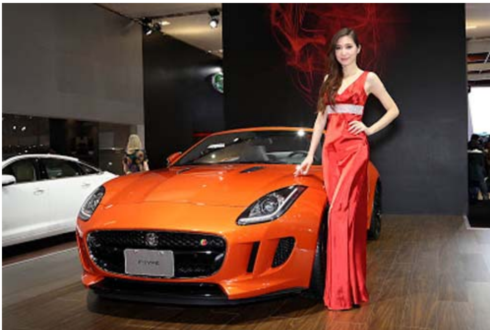
Jaguar F-Type S