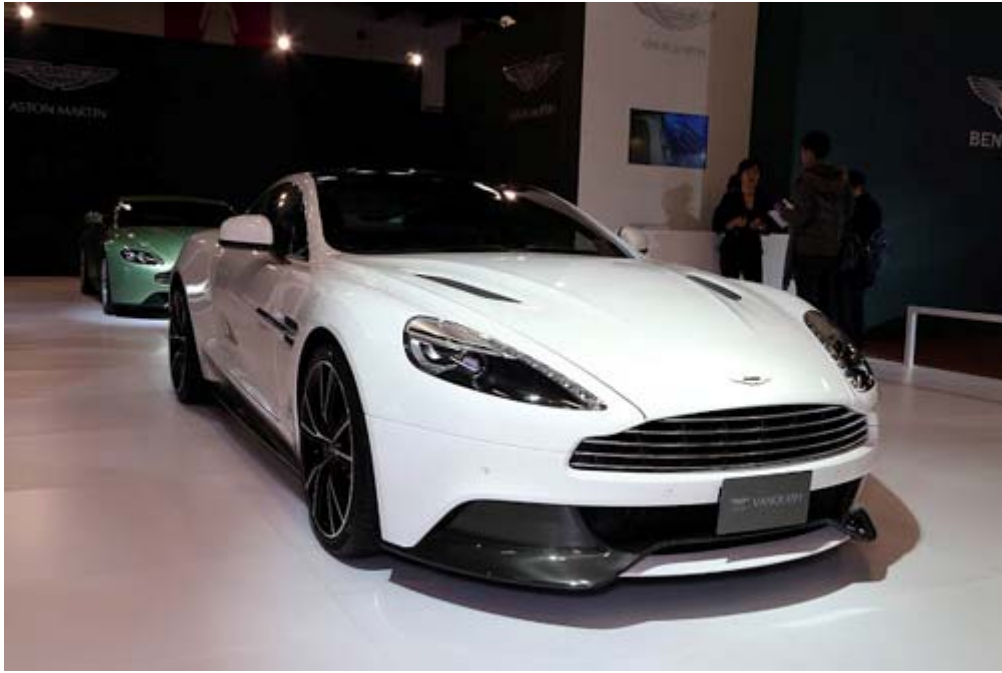
Aston Martin Vanquish，最新一代的 Halo Car， 全新世代 GT 跑車的極致演繹