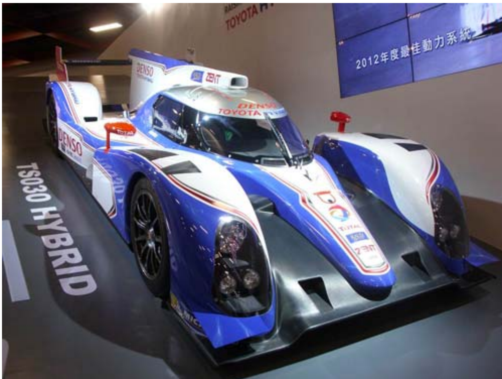
Toyota TS030 Hybrid LM 賽車顛覆傳統印象的複合動力賽車