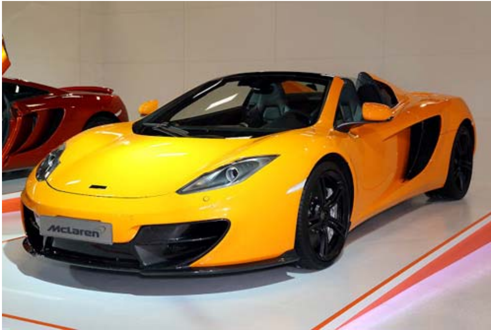
McLaren MP4-12C Spider