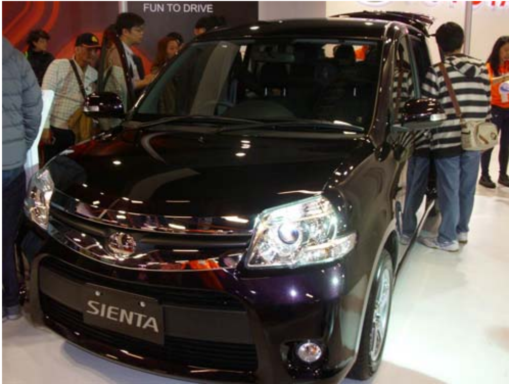
Toyota 小型 SUV 新選擇 Sienta