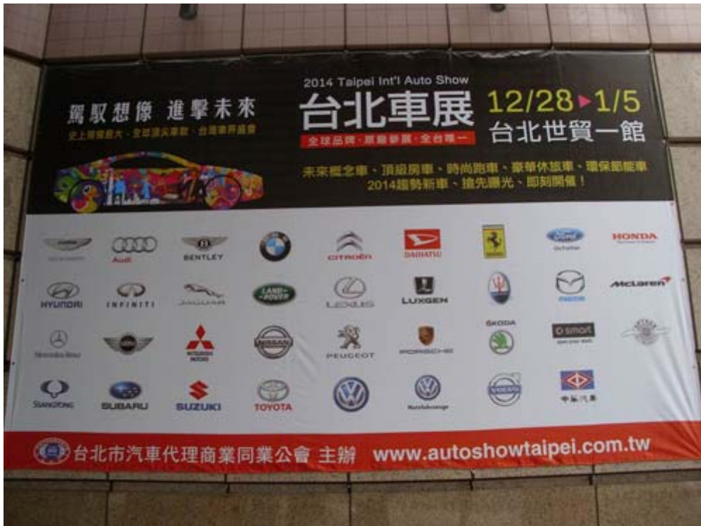
圖一、全球 35 個汽車品牌共同參與 2014 第 20 屆台北車展