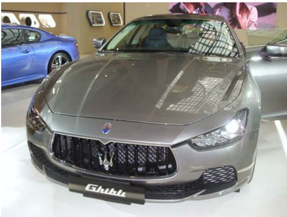
Maserati Ghibli S Q4 全新發表，傳達出義大利精神、豪華精緻、動感與性能，外觀完美融合優雅氣質和跑車風格的設計