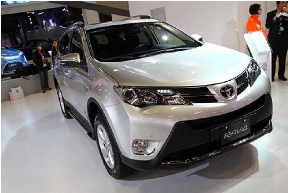
Toyota RAV4 2.5G 4WD