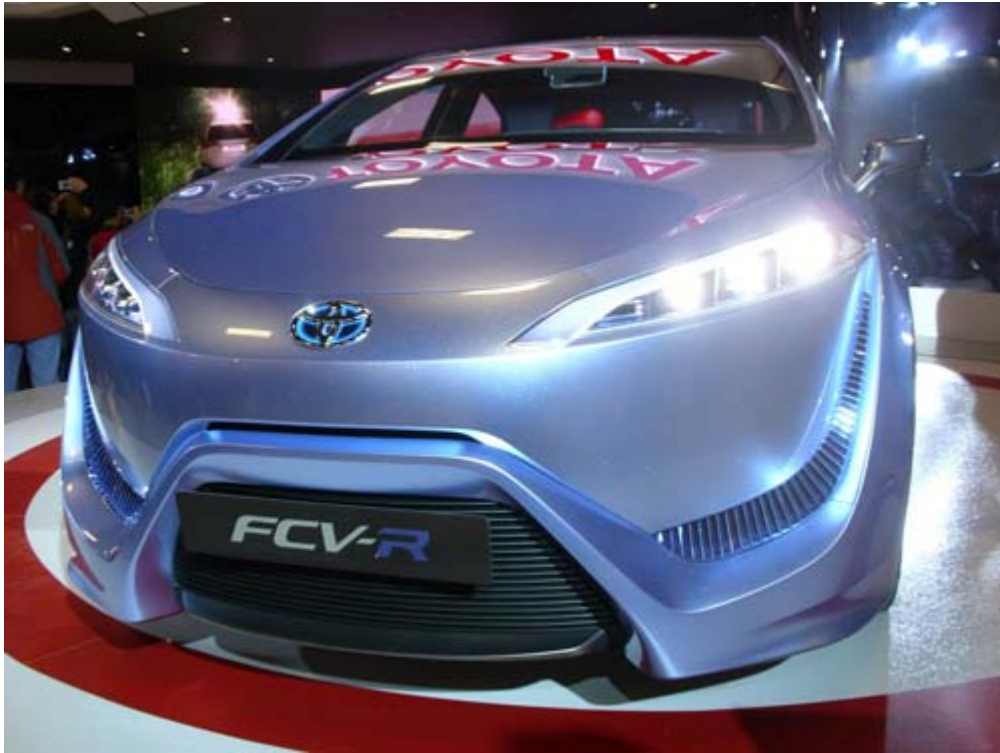
Toyota 概念車 FCV-R 同樣是在 2012 年東京車展 首度亮相的氫燃料電池車款