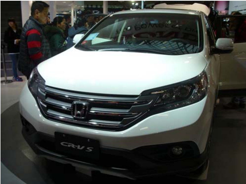
國產化的台灣本田汽車 CR-V 是台灣內銷量前十名車款之一