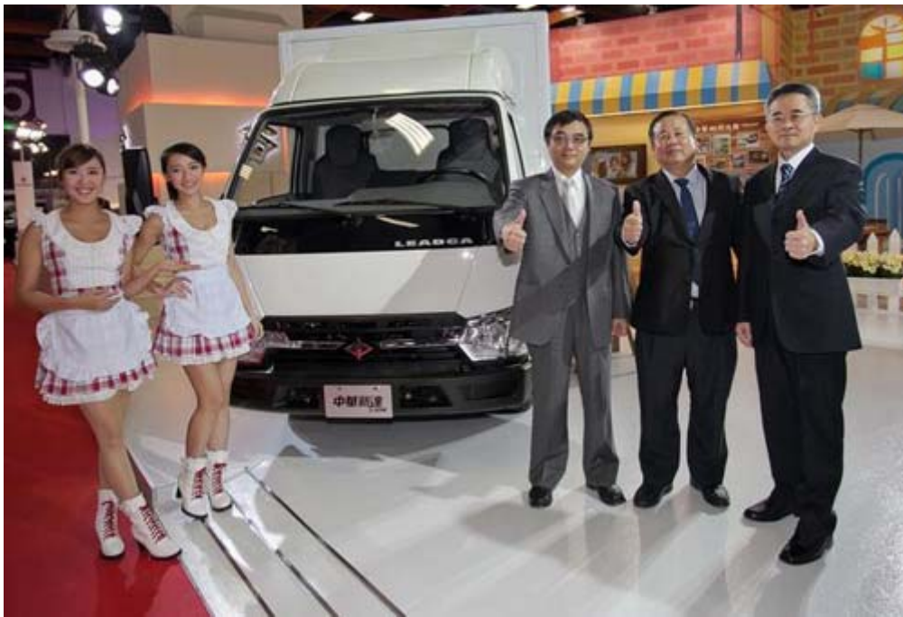
中華汽車自行設計開發的中華新達 3.5 噸貨車