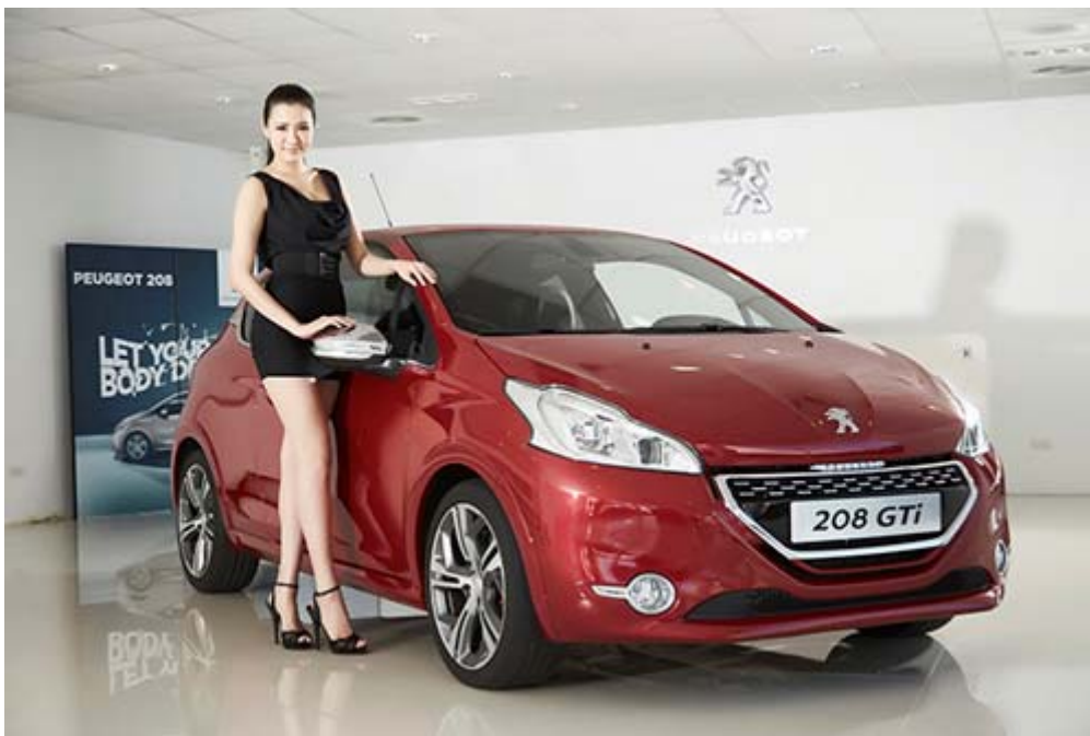
Peugeot 208 GTi