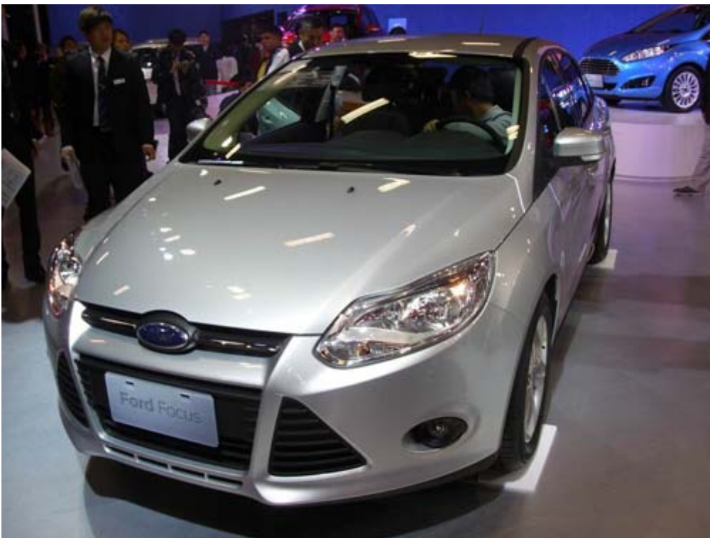
國產化的福特六和汽車 Focus 是台灣內銷量前十名車款之一