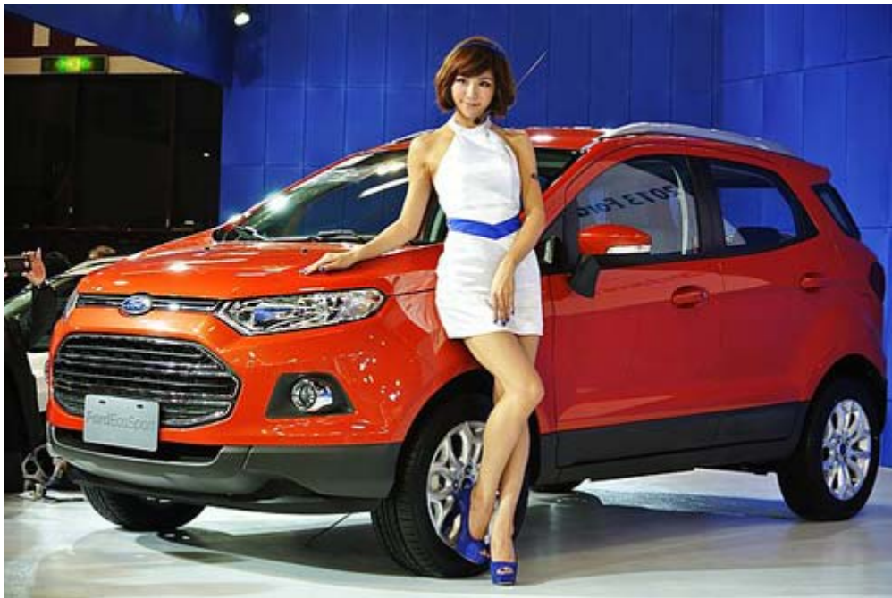
Ford 1.0L EcoBoost，最大馬力 123 hp/125 lb，油耗 32/45/37 mpg (City/Highway/Combined)