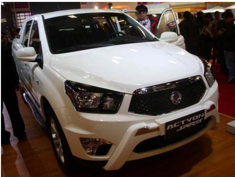
SangYong Actyon Sports