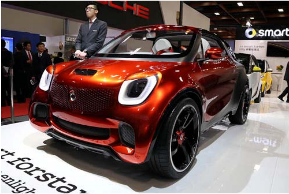
Smart ForStars Concept