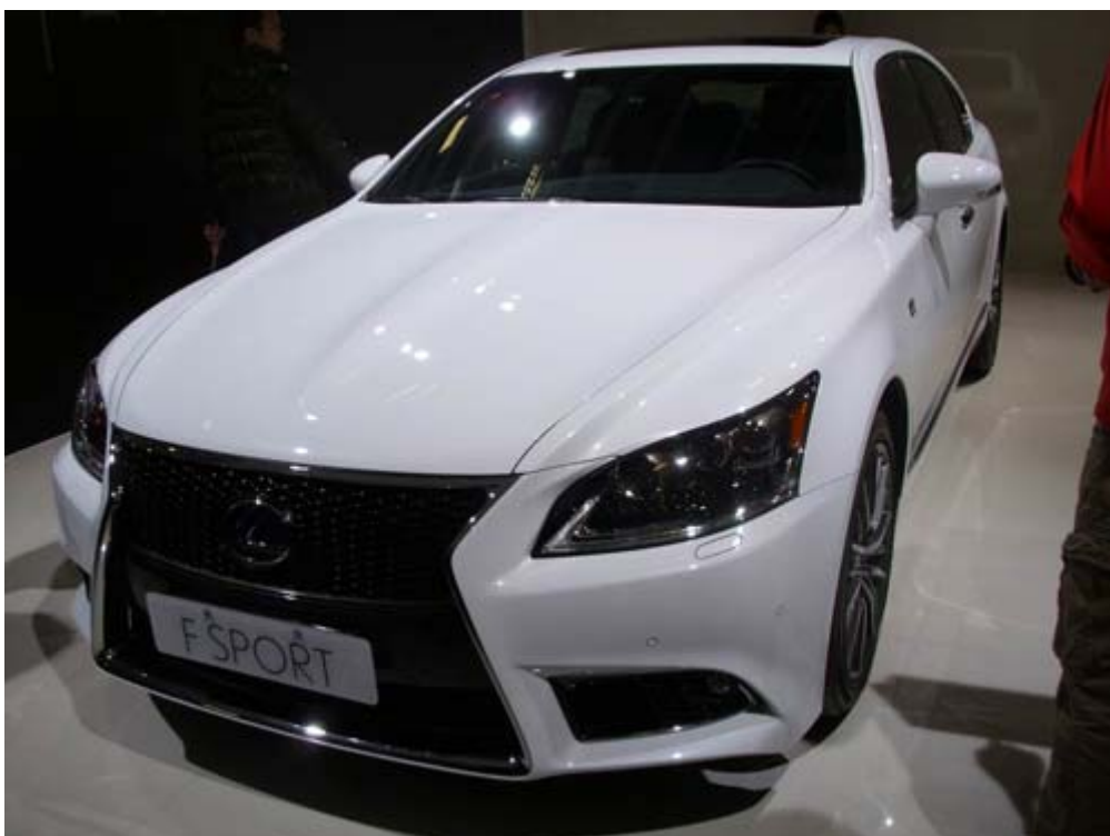
Lexus CT200h F Sport