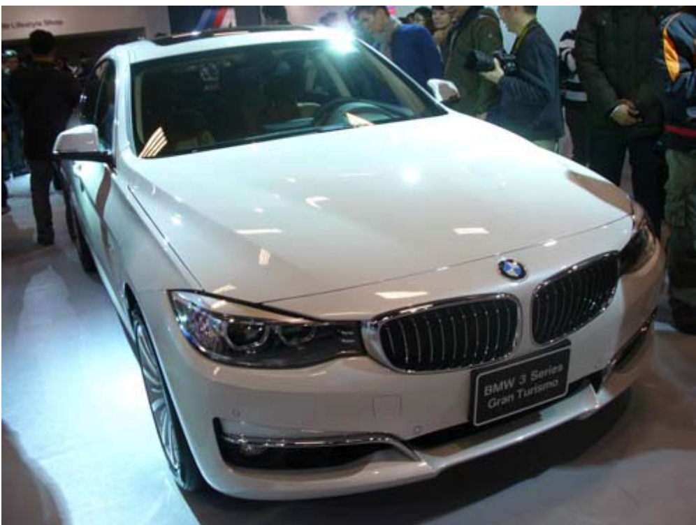
BMW 3-Series 是台灣進口車內銷量前十名之一