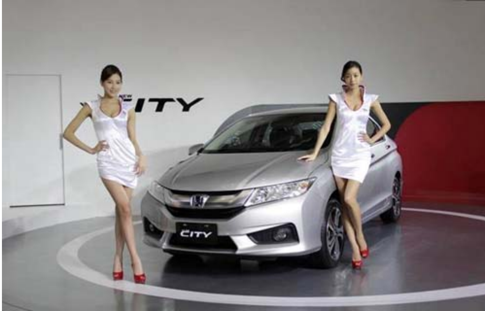
Honda 2014 New City