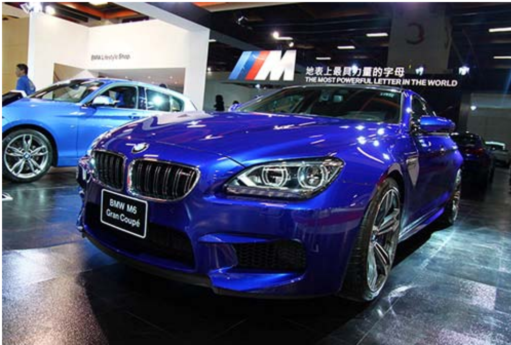
BMW M6 Grand Coupe