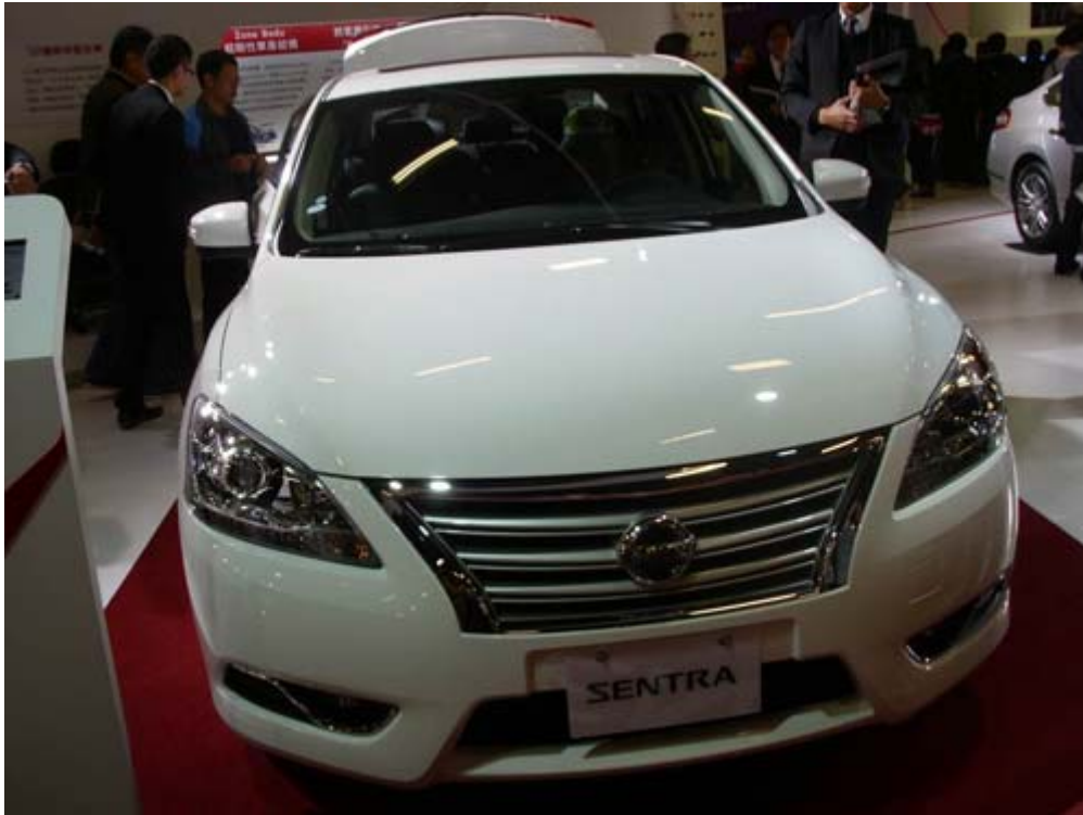
國產化的裕隆日產的大改型 Super Sentra 是 2014 年台灣汽車市場成長的動能之一