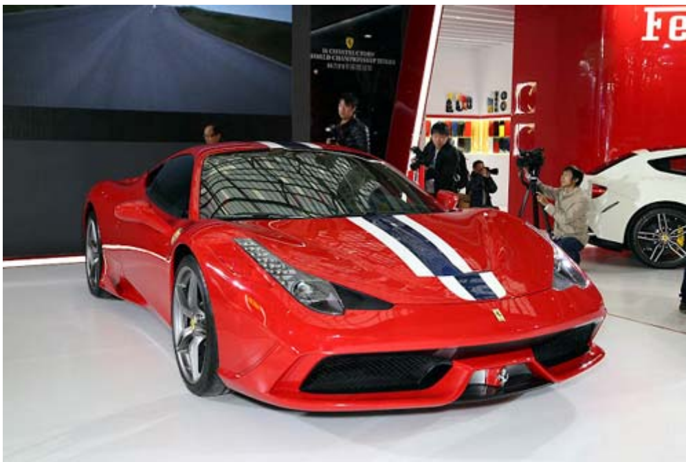
Ferrari 458 Speciale