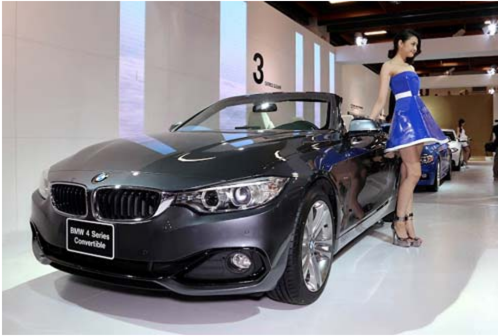
BMW 428i Convertible