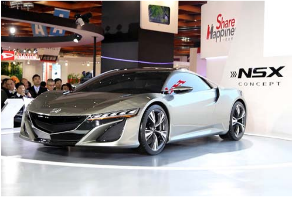
Honda NSX Concept I 「日本第一款超級跑車 NSX」， 是 Honda 大量導入 F1 造車理念與技術的市售車款