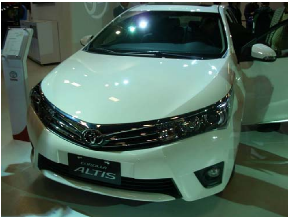
國產化的 Toyota All New Corolla Altis 是蟬聯多年台灣內銷量冠軍的車款，2013 年單一車款產銷量(含外銷)更超過 10 萬輛，創造台灣汽車產業新記錄。