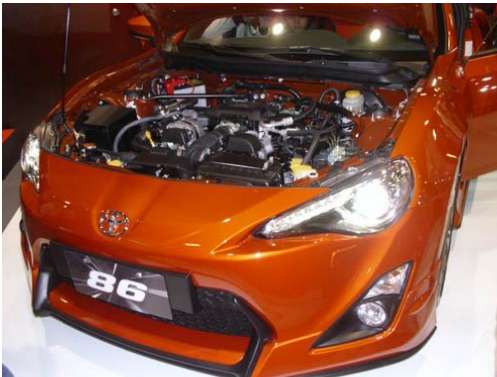
Toyota 86 Aero 稀有性能車款，跑車化駕駛座、輕鬆駕馭