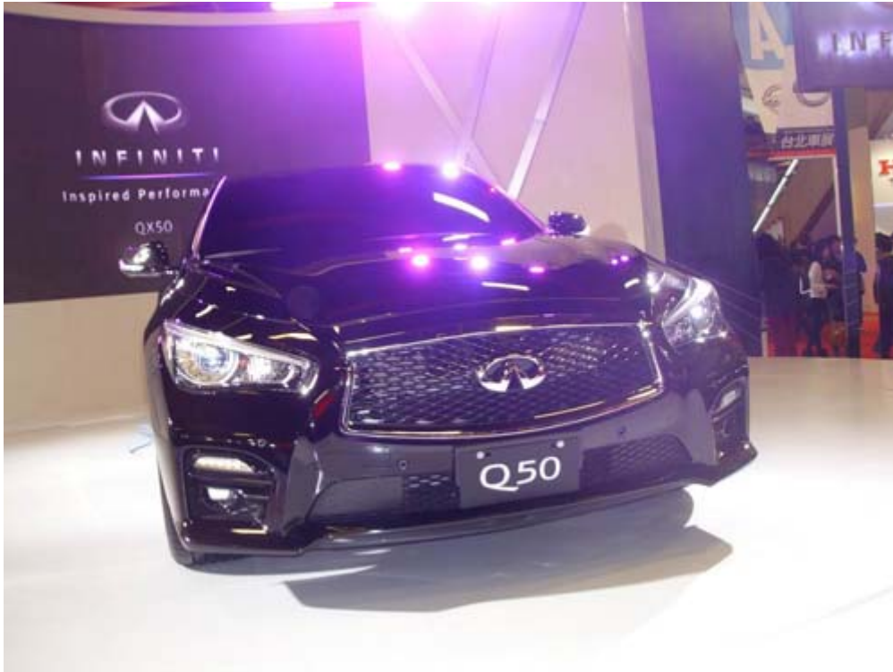
Infiniti 首度導入 Hybrid 動力車款 Q50，3.7 L V6 3.7L 引擎， 7 速自排變速箱，最大馬力 328 hp( 7000 rpm)