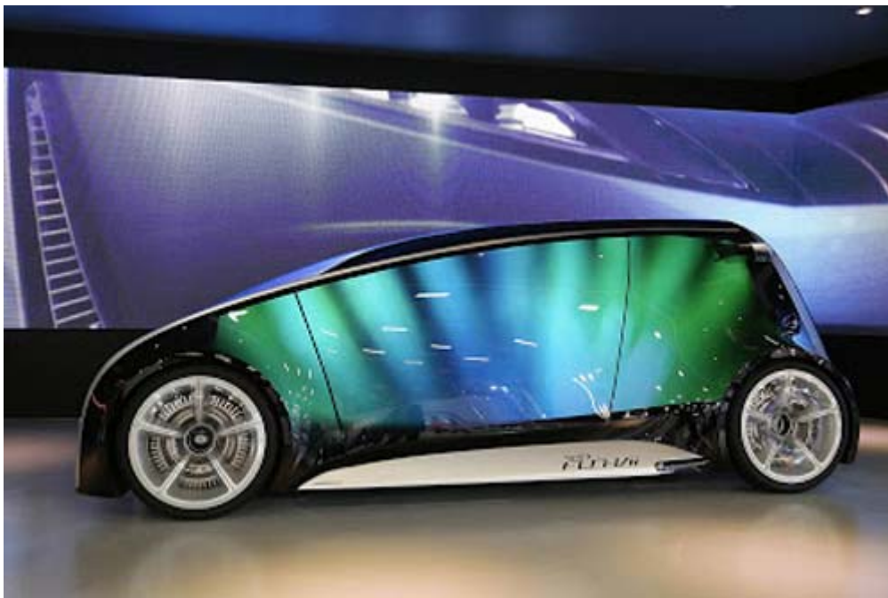
Toyota 概念車 Fun-Vii，重量只有 600kg