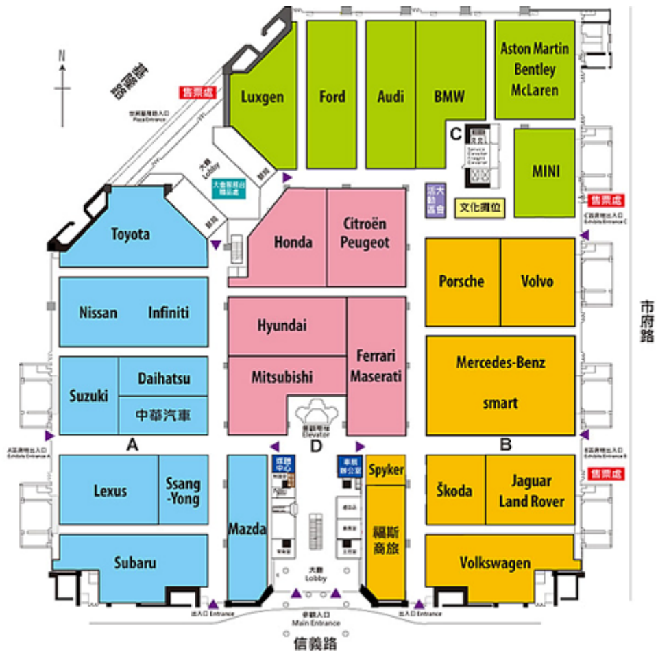
圖二、2014 台北車展展場 Layout