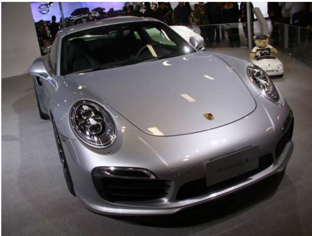
Porsche 經典跑車歡慶週年紀念 911 問世 50 年的 911 Carrera S