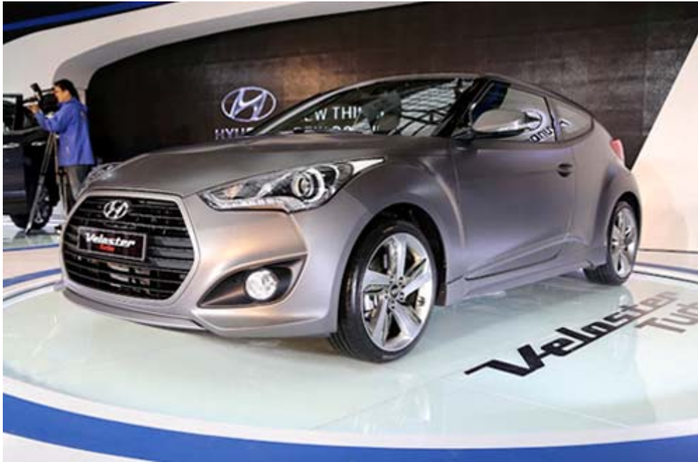
Hyundai Veloster Turbo