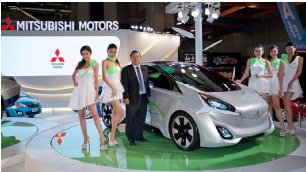
Mitsubishi CA-MiEV 概念車，綠能電動最遠行駛距離可達 300 公里，美型登場