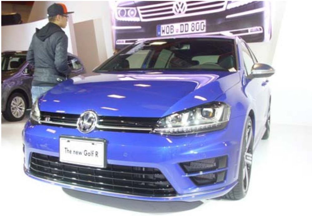
VW New Golf R