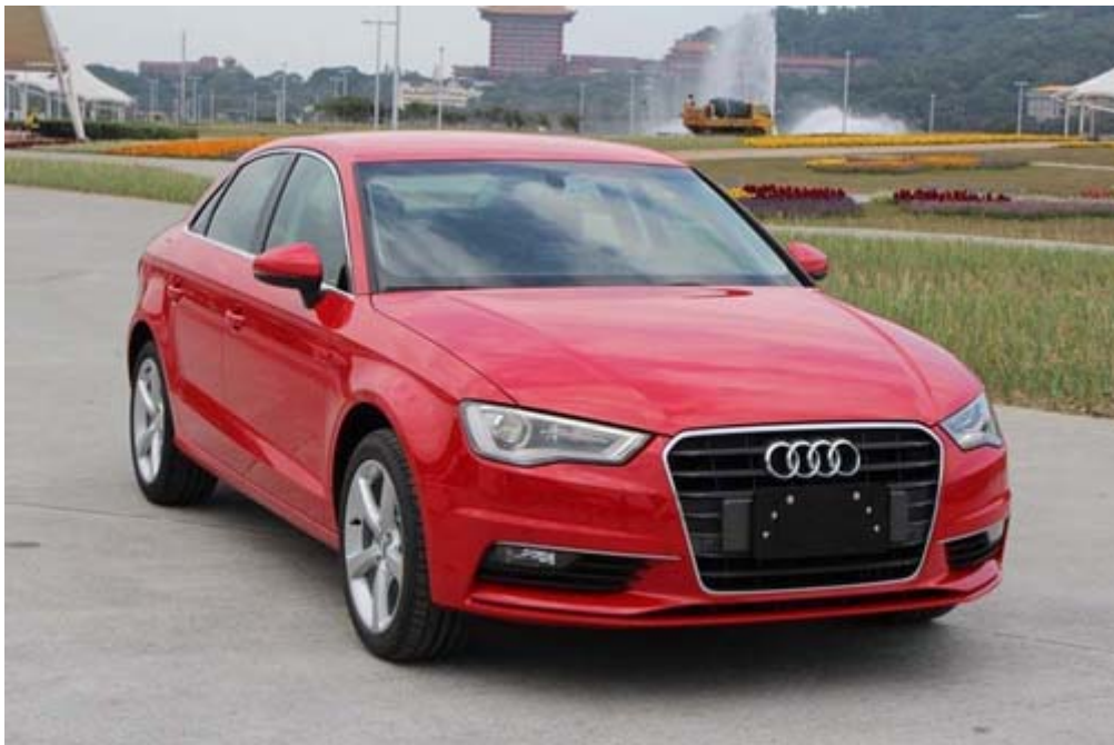
進口豪華小轎車 Audi A3 Sedan