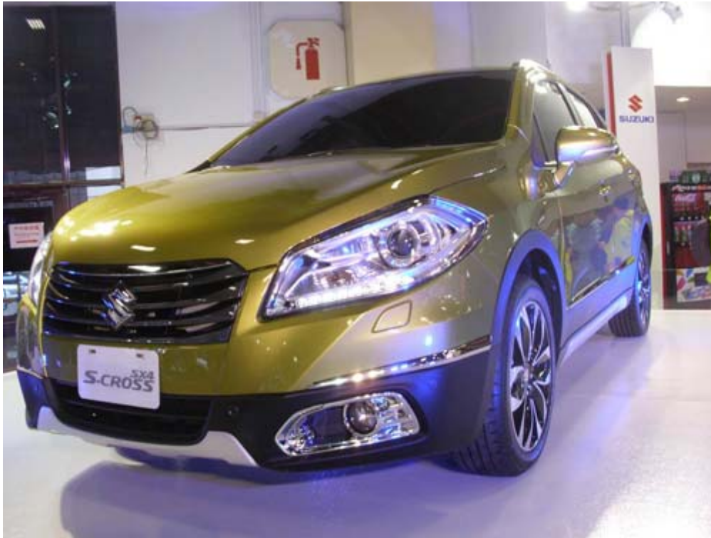
Suzuki 概念車 SX4S-Cross 跨界新美學！精湛風範·大膽進化。