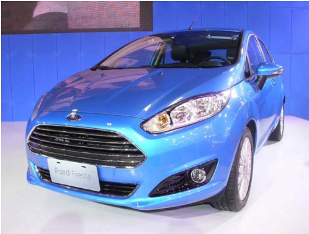
國產化的福特六和汽車 Fiesta