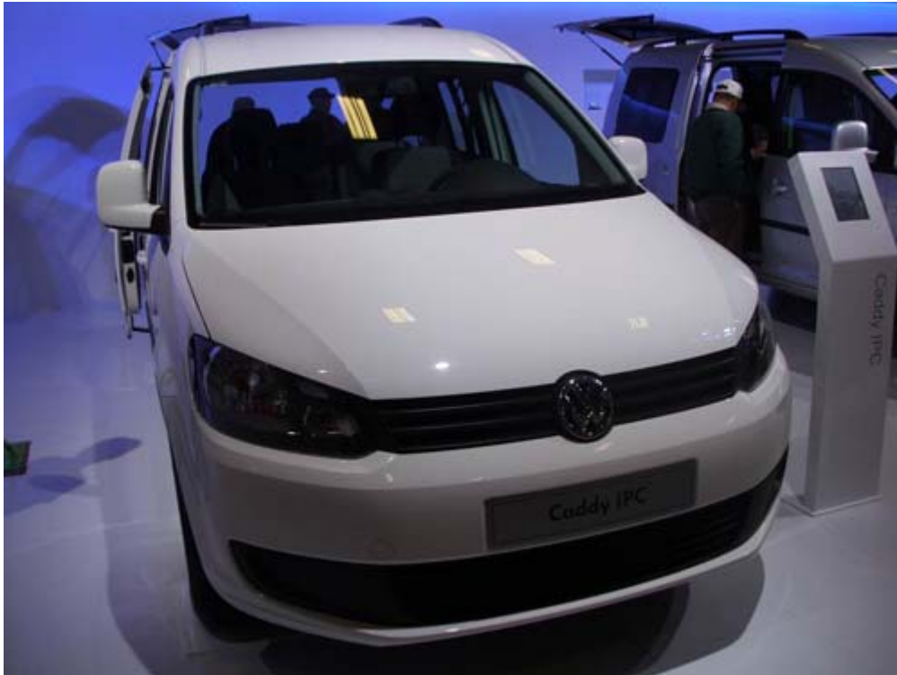
福斯商旅 Caddy IPC 空間大，可安裝固定輪椅裝置及方便輪椅上下車之輔助裝置成為福祉車。