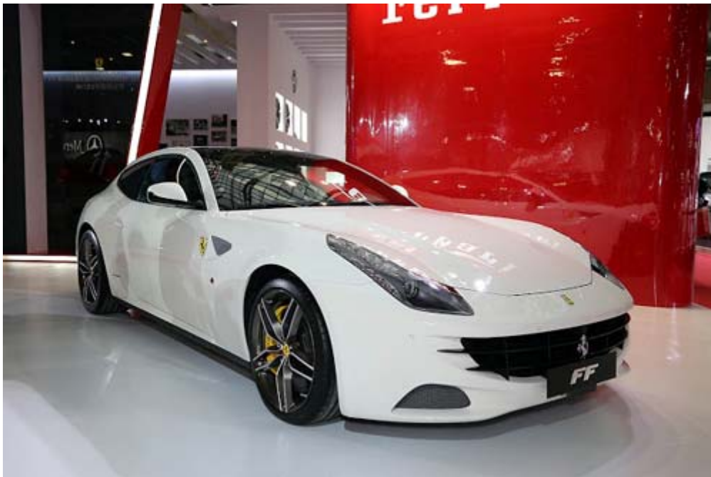
Ferrari 法拉利首度參展的最新車款 FF