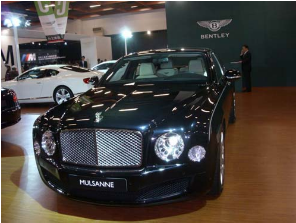
車壇頂極之作再現經典 Bentley Mulsanne