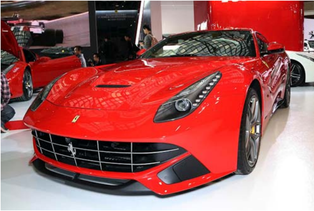
Ferrari F12 Berlinetta