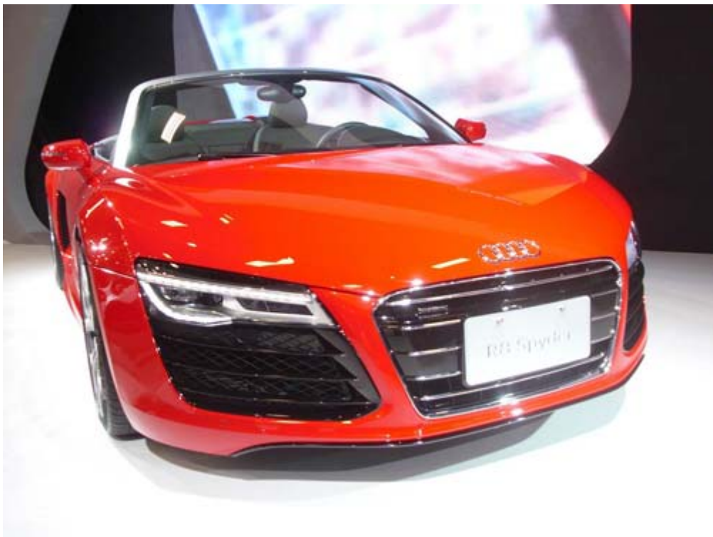
Audi 全新 R8 Spyder 旗艦敞篷超跑，0~100km/h 加速只需 3.8 秒， 電影「鋼鐵人系列」展現前衛科技駕座