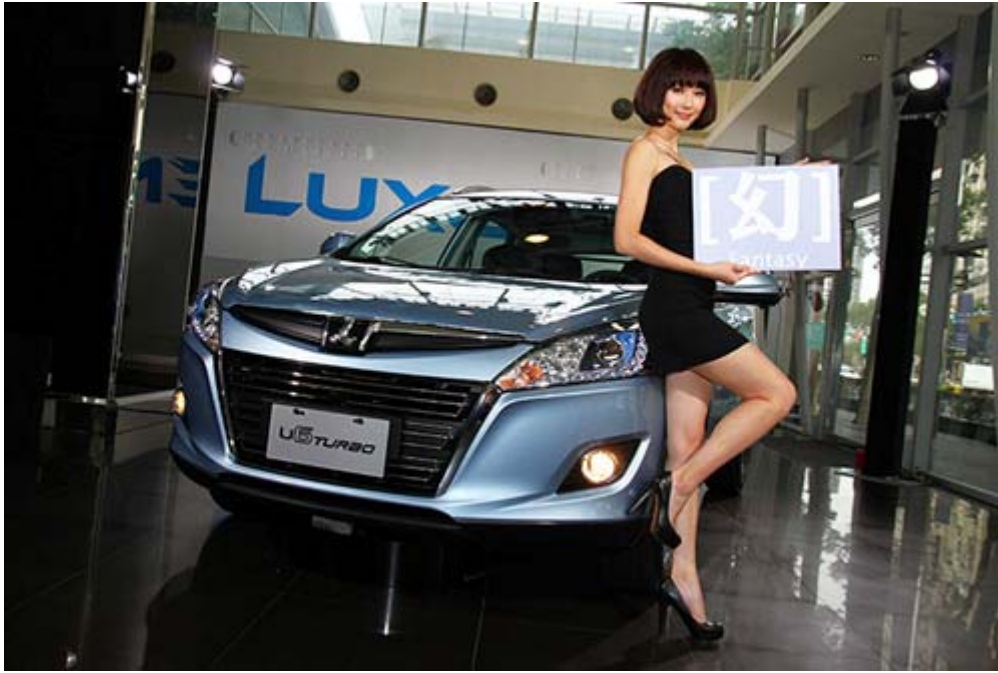
Luxgen U6 Turbo