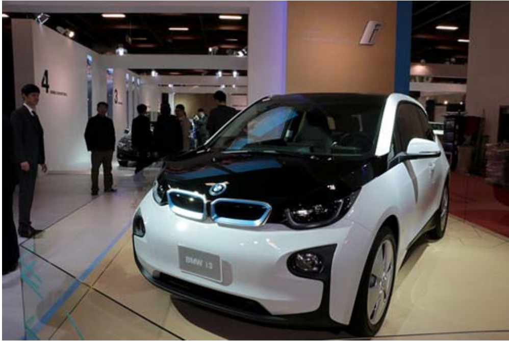
BMW 首款量產純電動車 BMW i3