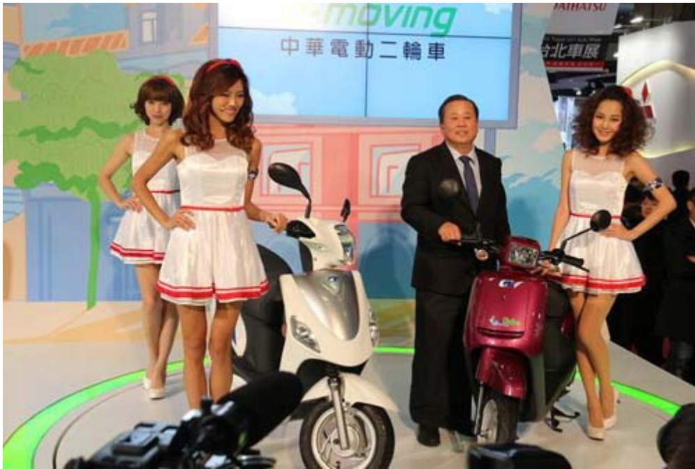
中華汽車自行開發設計的 e-moving 動動二輪車