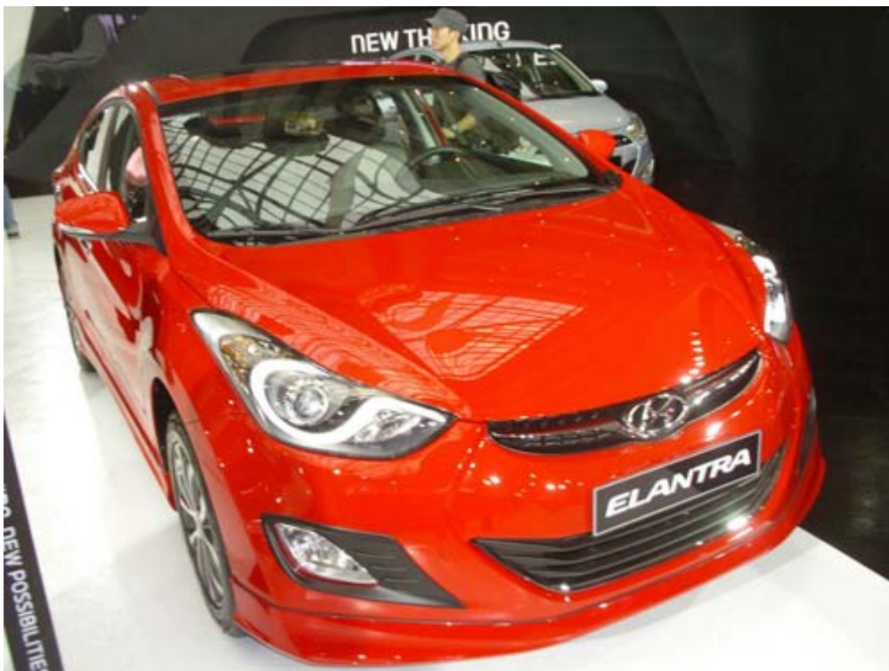
國產化的現代三陽 New Elantra