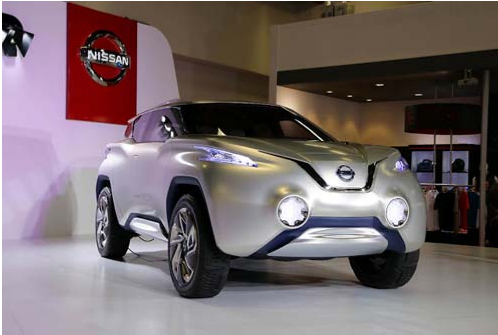
Nissan TeRRA 電動概念車，零排放的電動 SUV