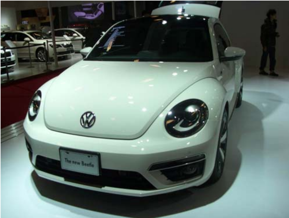
VW The New Beetle