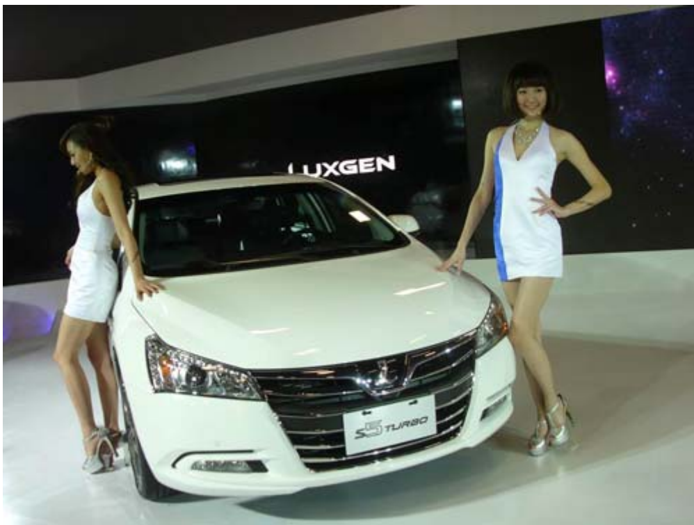
Luxgen New S5 Turbo