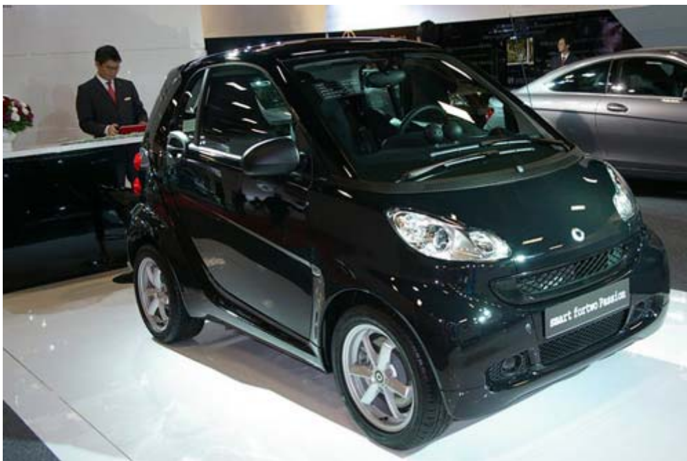
Smart for-two Pure